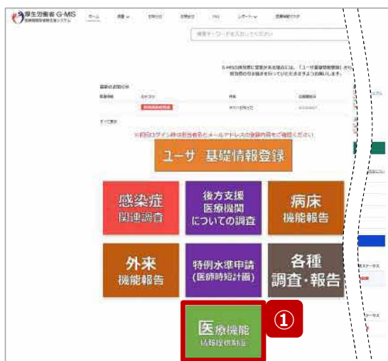
ホームページ（病院・診療所）