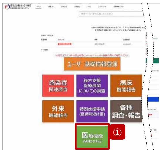
ホーム画面 (病院等)