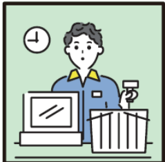
家計を支えるために労働をして、障がいや病気のある家族を助けている。