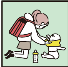
家族に代わり、幼いきょうだいの世話をしている。