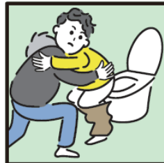
障がいや病気のある家族の入浴やトイレの介助をしている。

ヤングケアラーの支援については 市区町村の「こども家庭センター」 又は児童福祉担当部署までご連絡ください