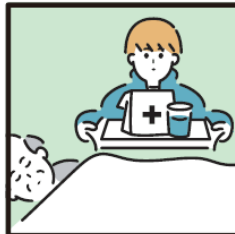
がん・難病・精神疾患など慢性的な病気の家族の看病をしている。