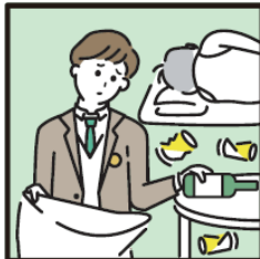
アルコール・薬物・ギャンブル問題を抱える家族に対応している。