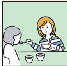
障がいや病気のある家族の身の回りの世話をしている。