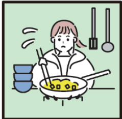
障がいや病気のある家族に代わり、買い物・料理・掃除・洗濯などの家事をしている。

ヤングケアラーを支援につなぐにあたっては、本人の意思を尊重すること、本人や家族の想いを第一に考えることが重要です。本人や家族との対話の中で緊急性を確認した上で、信頼関係を築きながら状況の把握をお願いします。