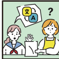
日本語が第一言語でない家族や障がいのある家族のために通訳をしている。