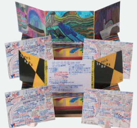
「山陰地方の要部での四季折々の風景」 清水 修二 | 2022 年度 銅賞