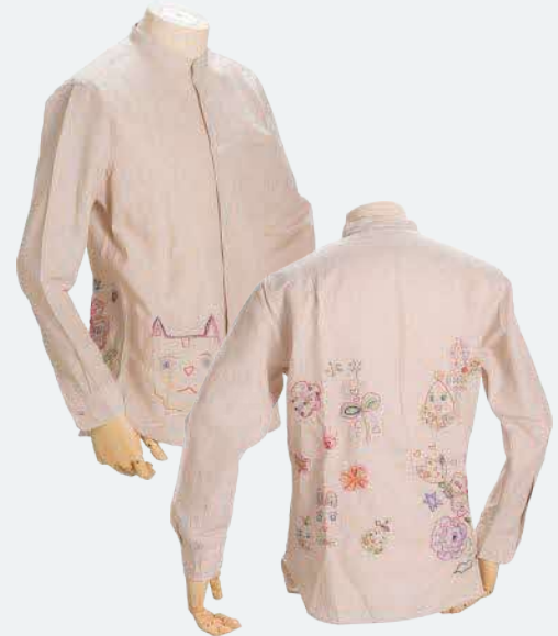
「ねこと花の森」 横田 佳代子 | 2022 年度 銅賞