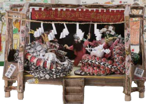
「昭和の大蛇」ファンキーミウラ | 2022年度 銀賞