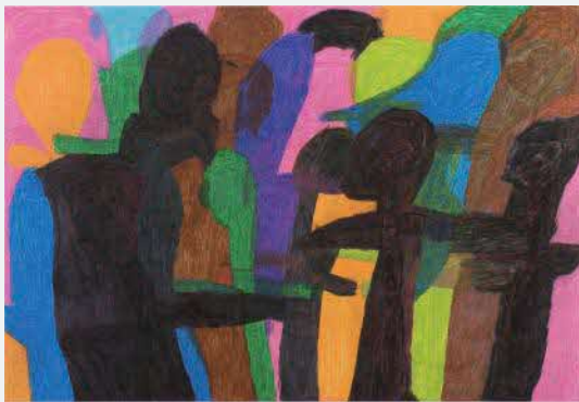
「ともだち達」 山本 千代子 | 2022 年度 銅賞