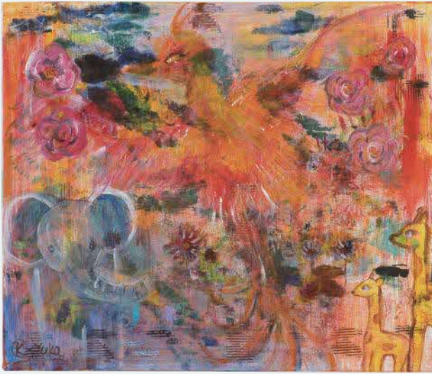
「Breath Back」 柏原 佑佳 | 2022 年度 銀賞