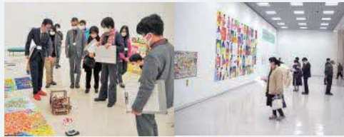
2022 年度公開審査会と展示会の様子

芸術・文化活動を通じた 障がい者の自立と社会参加を推進し、 県民の障がい者に対する 理解と認識を深めることを 目的として開催します。 展示される作品は 応募のあった島根県内の 障がいのある人が創作した作品を 審査した上で展示します。