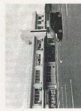
【写真4】離島の人の命を守る「隠岐島前病院」