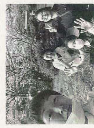
【写真5】患者を囲み、薬剤師、看護師、作業療法士とお花見に——多職種チーム医療