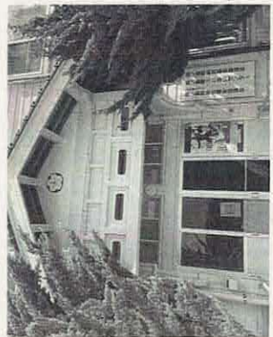
【写真1】 西ノ島町社会福祉協議会は廃校になった小学校の中に

一九九九年に島根県と隠岐島四町村を構成団体として設立。介護保険事業、隠岐病院・隠岐島前病院、救急医療対策事業、広域消防事業、障害者支援施設事業、隠岐航空フェリー、超電導船の設置、管理運営等に関する事務を行う。