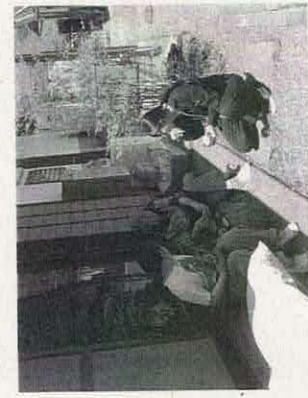
【写真3】「地域応援隊」が高齢者宅を訪問