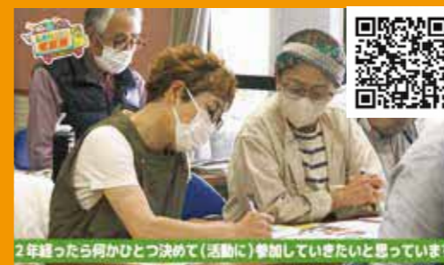
①しまねっこの宅配便 くにびき学園編