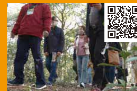
②くにびき学園制作 紹介動画