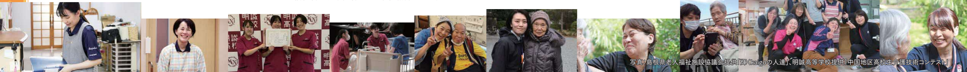
写真：島根県老人福祉施設協議会提供「輝くKaigoの人達」、明誠高等学校提供「中国地区高校生介護技術コンテスト」