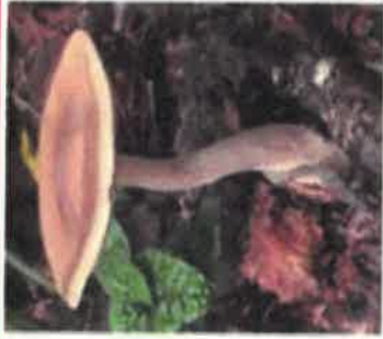
クサウラベニタケ