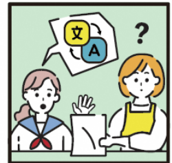
日本語が第一言語でない家族や障がいのある家族のために通訳をしている。