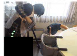
家事支援のイメージ