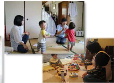
育児支援のイメージ