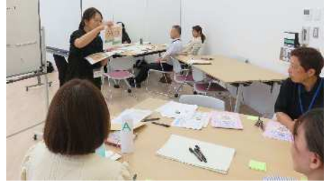
ファシリテーターとしてプログラムを演習