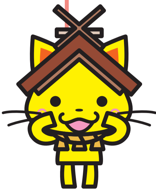
島根県観光キャラクター「しまねっこ」 島観連許諾第 6780 号

すぐにたべえるなら、手前から取る。 たったそれだけで 食品ロスを減らせるんです。