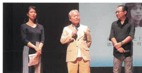
被害者御家族による呼びかけの様子

(※)「特定失踪者」とは、民間団体である「特定失踪者問題調査会」が、「北朝鮮による拉致かもしれない」という御家族の届出等を受けて、独自に調査の対象としている失踪者のこと。