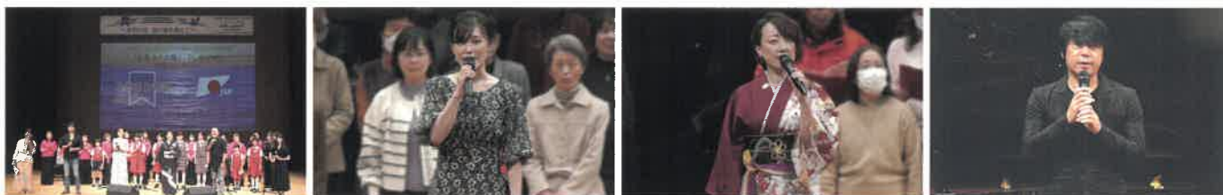
共同ライブコンサートの様子