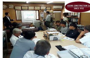
外部セミナー実施