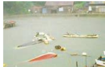
쓰나미 피해를 입은 선박들

1993년 7월에 발생한 홋카이도 난세오키지진(M7.8)에 의한 쓰나미로 오키지방, 시마네반도를 중심으로 가옥이 침수되었고 선박, 항만시설 등의 피해가 있었습니다.