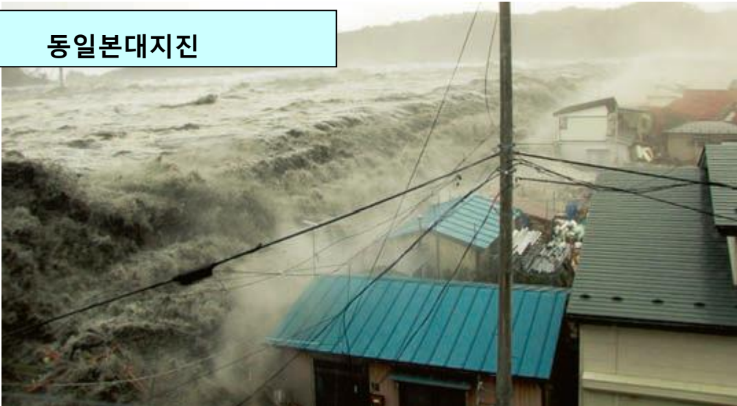
제방을 넘어 마을을 덮치는 쓰나미