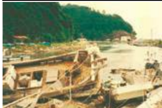
쓰나미 피해를 입은 선박들

1983년 5월에 아키타현 해안에서 발생한 니혼카이 중부지진(M7.7)에 의한 쓰나미로 오키지방, 시마네반도를 중심으로 가옥이 침수되었고 선박, 항만시설 등의 피해가 있었습니다.