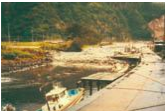
강을 거슬러 오르는 쓰나미