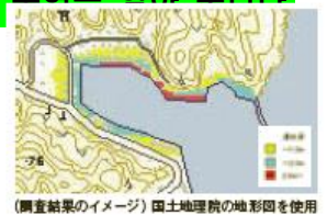
(調査結果のイメージ) 国土地理院の地形図を使用