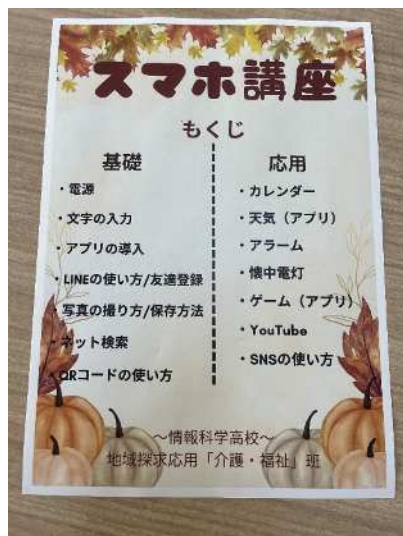
(高校生によるスマホ教室)