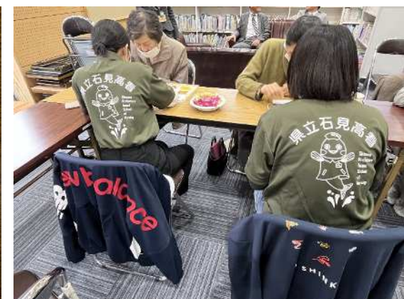
(看護学校生によるスマホ教室)