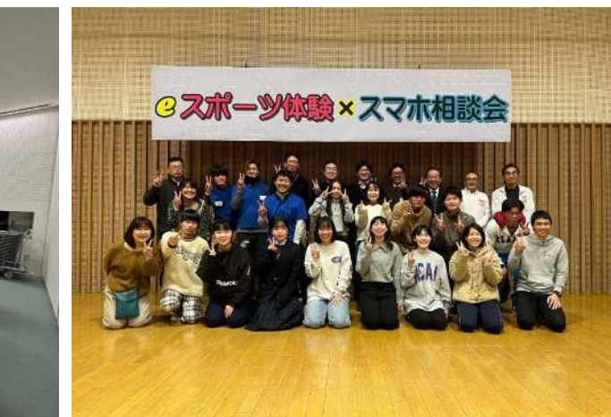
(eスポーツ&スマホ相談会※高校生講師)