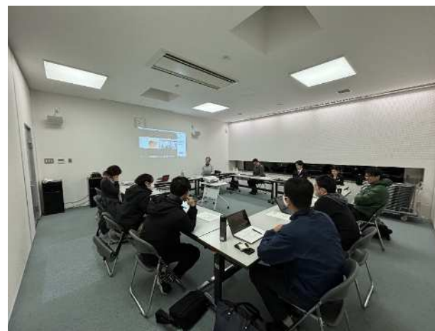
(デジタル活用講師育成講座)