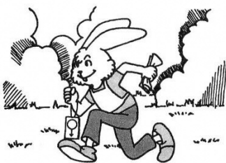
走るだけではだめ!