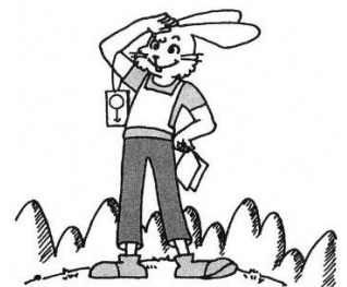
いつもおちついて!

小雨決行 ☆競技形式 フリーポイント・オリエンテーリング はじめての方に楽しんでもらうコースです ☆受付時間 10:00~14:30 ☆競技 10:10~15:00 随時スタートします。 ☆地図 縮尺 1:2,500 等高線間隔 2m ☆クラス