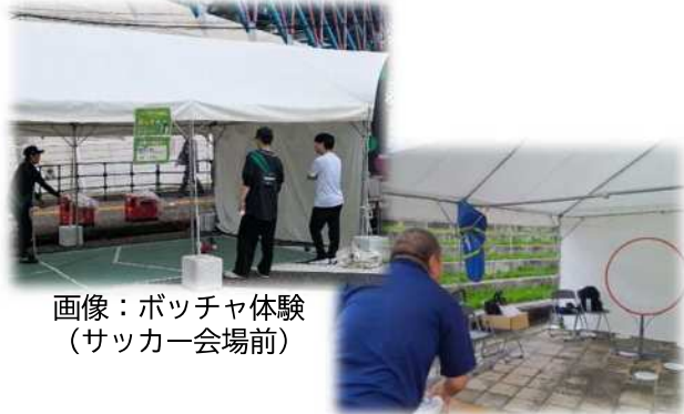
画像：ポッチャ体験 (サッカー会場前)