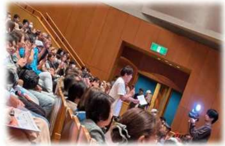
画像：サテライト会場