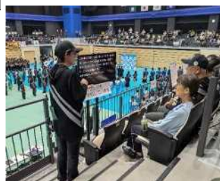
画像：表彰式の手話 (情報保障席)