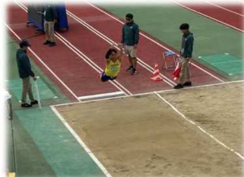
画像：陸上競技の様子