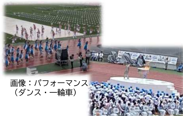
画像：パフォーマンス (ダンス・一輪車)