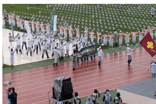
画像：選手団入場（式典台前パフォーマンス）