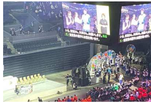
画像：オープニングプログラム （選手インタビュー）