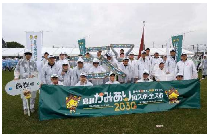
画像：開会式前集合写真