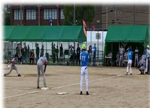
画像：グラウンドソフトボール競技の様子