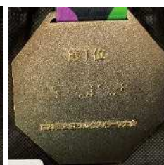
画像：メダル裏 (点字あり)