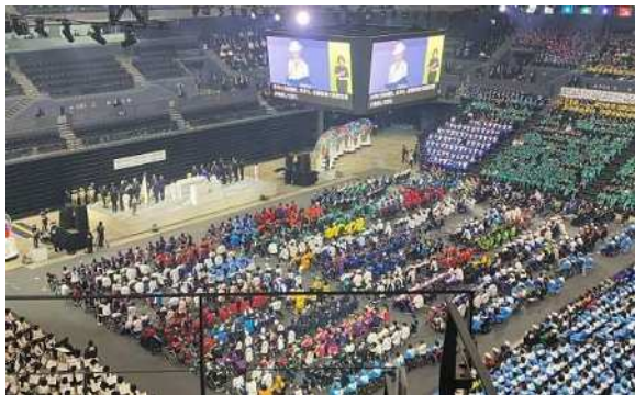
画像：本会場全体 （1階フロア車いす席）