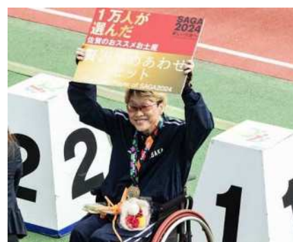
画像：表彰者目録を掲げる様子

画像：スポーツ庁Web広報マガジン 誰もが自分らしく輝ける“新しい”大会 ～「SAGA2024 全国障害者スポーツ大会」～