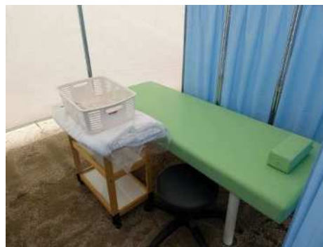
画像：フットソフトボール会場

全競技で設置。屋外競技においては、仮設テント内にパーテーションでエリアを仕切って設置していた。