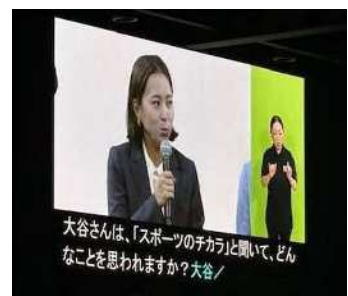
画像：閉会式会場のモニター

要約筆記については、事前にプリントアウトしたものを掲示するなど省力化の工夫をしていた。