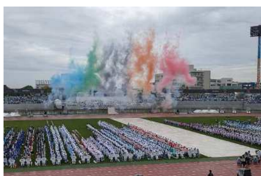
画像：フィナーレ演出