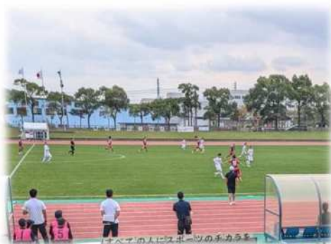
画像：サッカー競技の様子