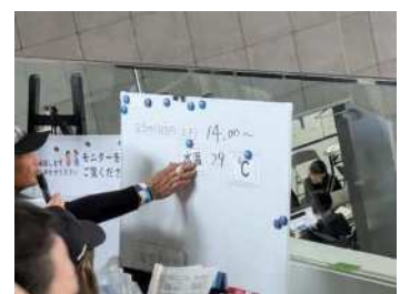
画像：要約筆記ホワイトボード (情報保障席)