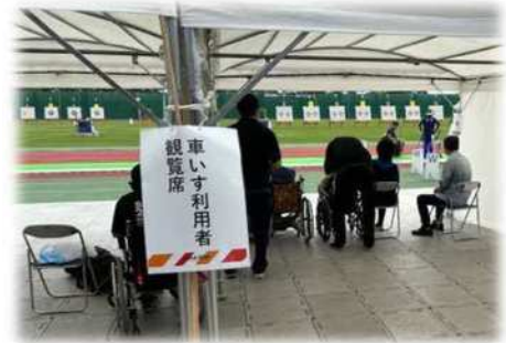
画像：仮設車いす席（アーチェリー）