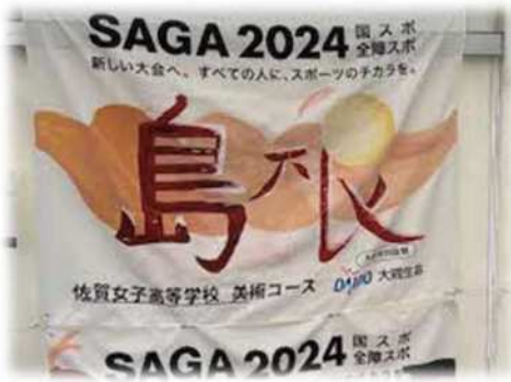
画像：ボウリング会場応援横断幕（島根県）