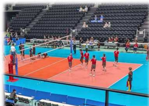
画像：バレーボール競技の様子