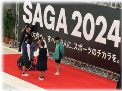
画像：水泳会場表彰