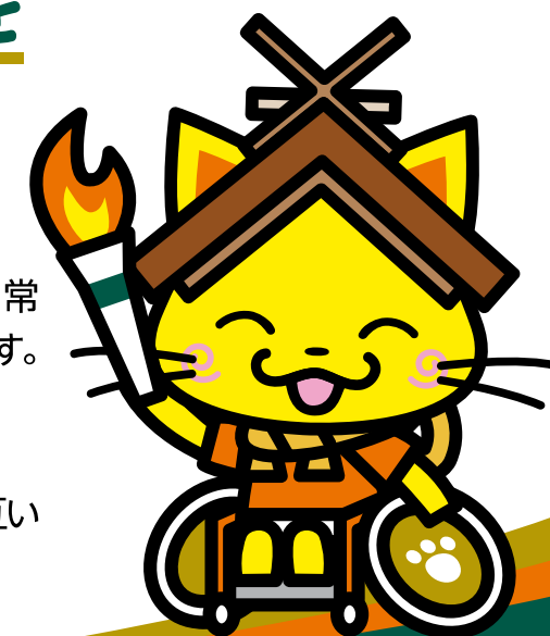
島根県観光キャラクター 「しまねっこ」

全ての人と一緒にスポーツを楽しむことで、絆を育み、お互いを理解し、支え合う意識をもてる社会を目指します。