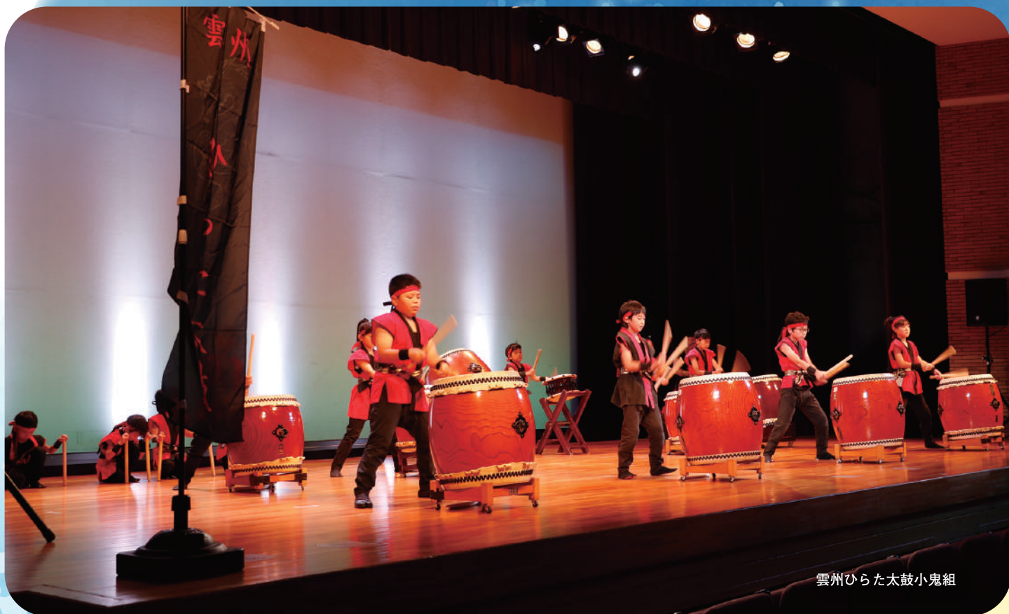
雲州ひらた太鼓小鬼組