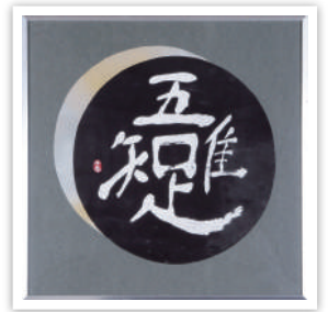
硬筆アート 知事賞受賞作品