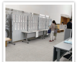
しまね文芸フェスタ 2023