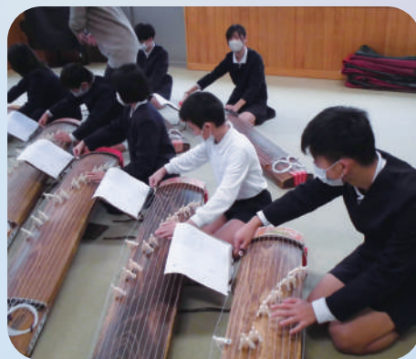
島根県三曲連盟 ワークショップ

◆応募のあった学校等へ地元の文化芸術団体を派遣し、文化芸術の鑑賞機会の提供、ワークショップ（実技指導・鑑賞指導等）を行うことにより、子どもたちの創造力やコミュニケーション力の向上を図り、将来の文化芸術の担い手の育成や芸術鑑賞能力の向上につなげます。