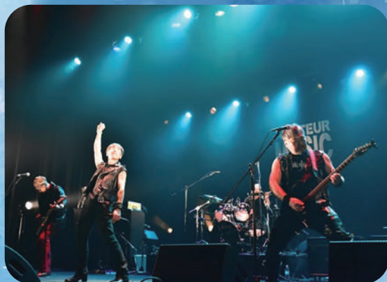
サウンドライブしまね アマチュアミュージックフェスティバル