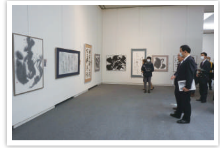
第56回島根県総合美術展

移動展 3月 6日(木)～3月 9日(日) / 島根県芸術文化センター グラントワ(益田市)