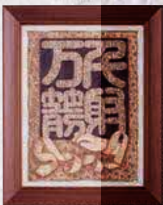
▲筆具:ウツバーニング(電熱ペン)