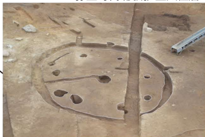
弥生時代(中期) 竪穴住居