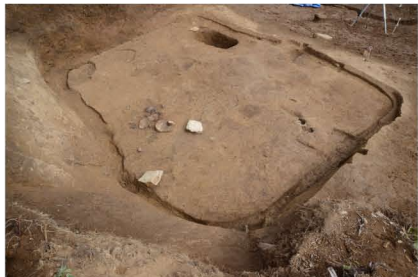
古墳時代(中期) 竪穴住居