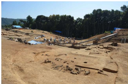
弥生時代(後期) 竪穴住居