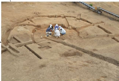
弥生時代(後期) 竪穴住居