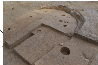
弥生時代(後期) 竪穴住居