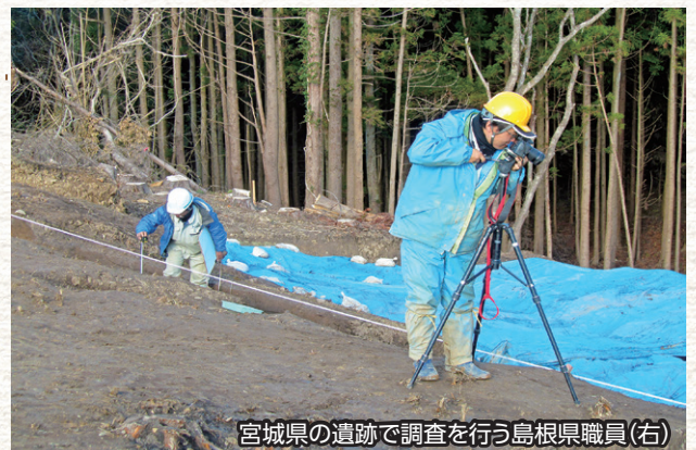
宮城県の遺跡で調査を行う島根県職員(右)

この年の10月から東日本大震災の復興事業に伴う発掘調査の支援のため、センター職員が宮城県に派遣されました。派遣は宮城県を対象に平成26年度まで継続して行われました。