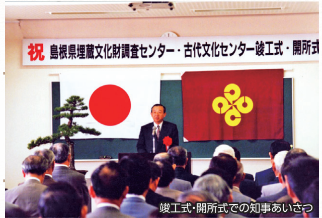
竣工式・開所式での知事あいさつ

センター本館の建設に着工しました。臼コクリ遺跡（安来市）で単鳳環頭大刀が出土しました。