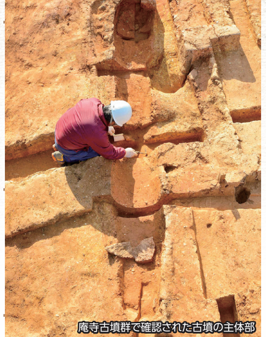
庵寺古墳群で確認された古墳の主体部

庵寺古墳群(大田市)の調査が開始され、のべ3か年度の調査で小高い丘の上から古墳24基や、弥生時代のムラの跡が発見されました。