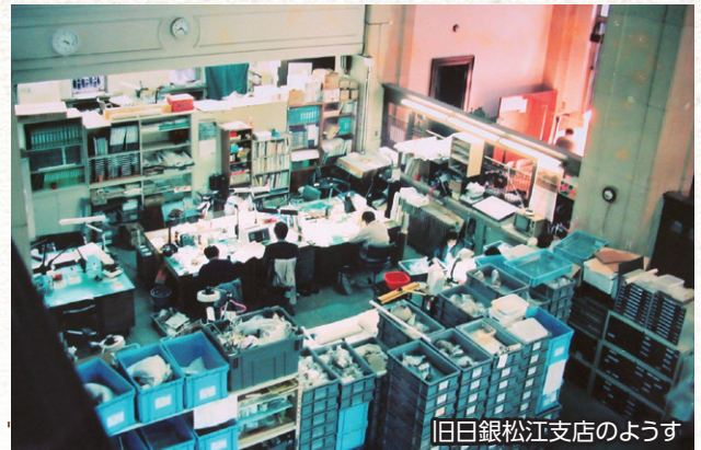
旧日銀松江支店のようす

センターができるまで埋蔵文化財の整理作業は旧日銀松江支店（現カラコロ工房）で行われていましたが、昭和50年代後半から県内で急増した発掘調査に対応するため、センターの設置が決定されました。この年センターの収蔵庫の建設工事が始まりました。