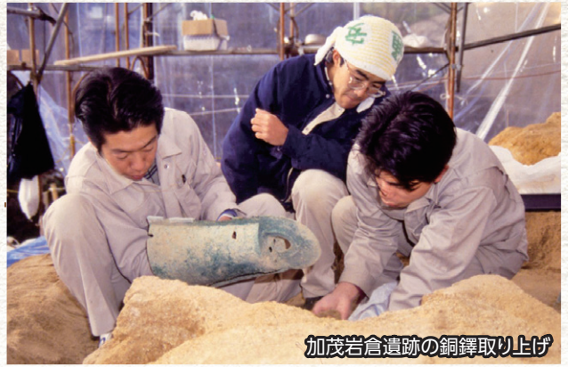
加茂岩倉遺跡の銅鐸取り上げ