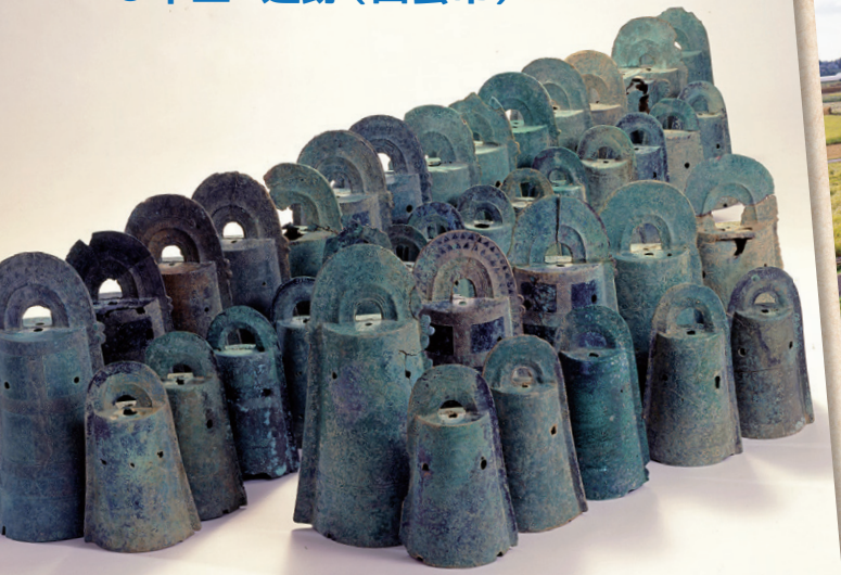
加茂岩倉遺跡出土銅鐸 (平成8年)