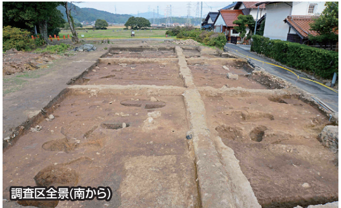
調査区全景(南から)