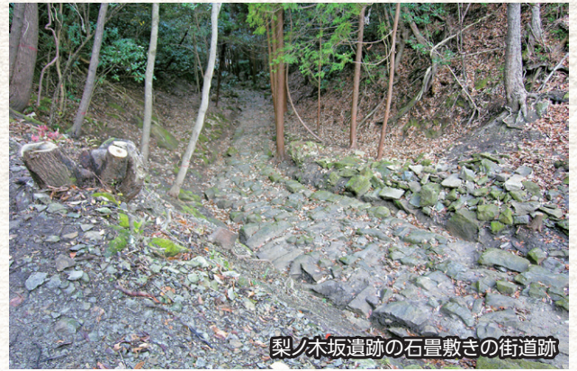
梨ノ木坂遺跡の石畳敷きの街道跡

石見銀山が世界遺産に登録されたこの年、梨ノ木坂遺跡(大田市)で石見銀山への往來に利用された石畳敷きの街道跡を調査しました。この年古代出雲歴史博物館がオープンし、八雲立つ風土記の丘展示学習館もリニューアルオープンしました。