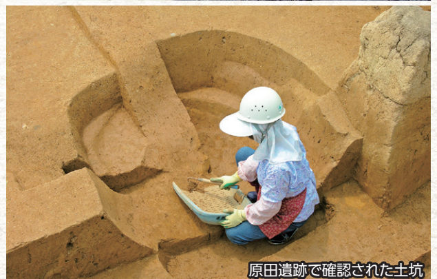
原田遺跡で確認された土坑

はらだ 原田遺跡(奥出雲町)で旧石器時代の遺跡を大規模に調査し、遺構や遺物が確認されました。なかでも約2万年前の土坑は島根県で初めての発見で、墓の可能性が指摘され、注目されました。