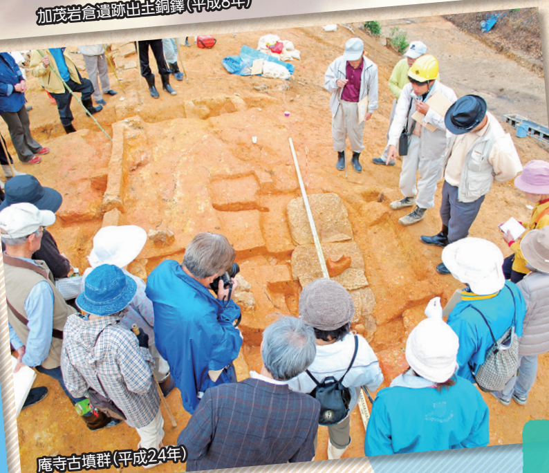
庵寺古墳群 (平成24年)