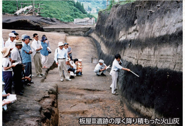
板屋Ⅲ遺跡の厚く降り積もった火山灰

かもしわくら 加茂岩倉遺跡(雲南市)で林道工事中に偶然銅鐸が発見されました。日本最多の39個の銅鐸が出土し、大騒動に…。その後銅鐸は国宝に指定されました。また板屋Ⅲ遺跡(飯南町)では、三瓶山の噴火と遺跡の関係がわかるなど縄文時代の発見も多い年でした。