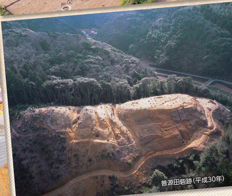
普源田砦跡 (平成30年)

イベントレポート いにしえ倶楽部連続講座 パンフレット紹介「静間城跡」 しまねのまいぶんミュージアム 島根大学総合博物館