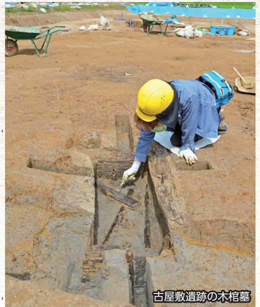
古屋敷遺跡の木棺墓