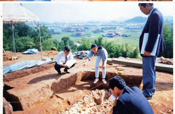
塩津山1号墳での説明のようす

しおつやま 塩津山1号墳（安来市）で竪穴式石室のほか6基の埋葬施設が確認され、弥生時代の墓の伝統を残す古墳として注目されました。この他にも安来地区で発見が相次いだ年でした。