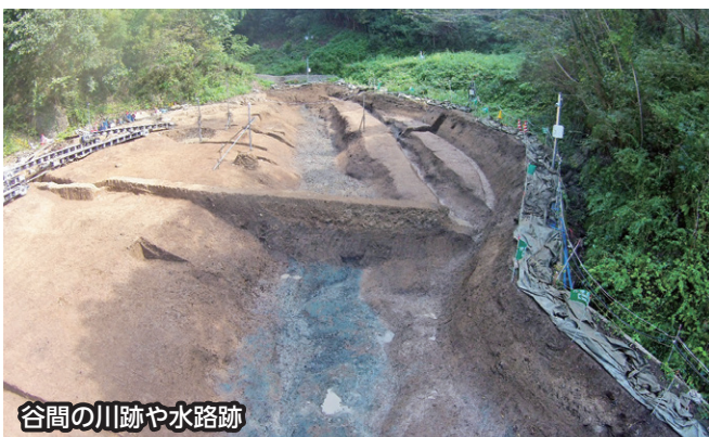
谷間の川跡や水路跡

今回の成果は、九景川下流域における当時の集落の様子を知るうえで貴重な調査例といえます。また、盛土層は中世の造成跡と思われる、神西城跡との関連が注目されます。