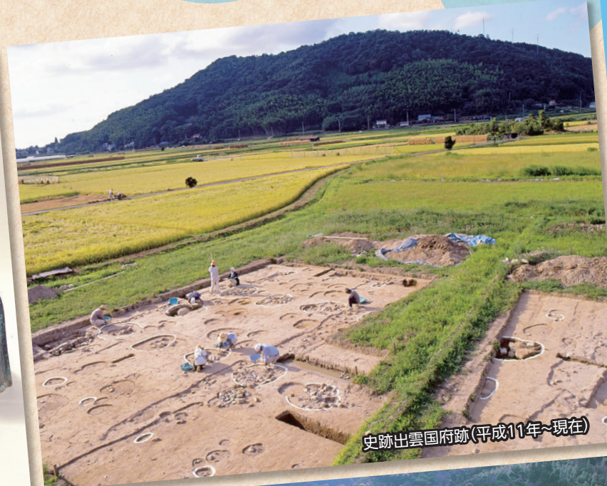
史跡出雲国府跡 (平成11年~現在)