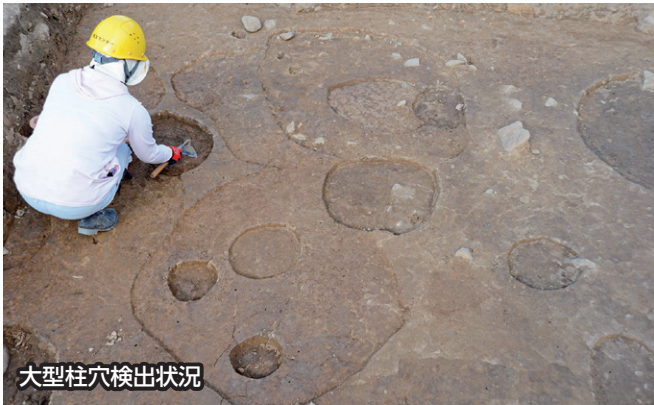
大型柱穴検出状況

今回の調査で新たに政庁域に掘立柱建物跡が存在していたことが分かり、政庁域の建物配置などを考える上で重要な発見となりました。