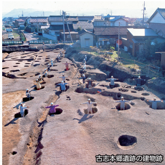
古志本郷遺跡の建物跡

こしほんごう 古志本郷遺跡(出雲市)で奈良時代の役所、 かんどくうけあと 神門郡家跡と推定される建物群が発見されました。 にしかわづ 西川津遺跡(松江市)では人面付土器が出土したほか、 みさきたに 御崎谷遺跡(隠岐の島町)で日露戦争にかかわる海軍望楼跡 ぼろうあつと が発見され注目を集めました。この年、「いにしえ倶楽部」がスタート、『ドキ土器まいぶん』の刊行がはじまりました。