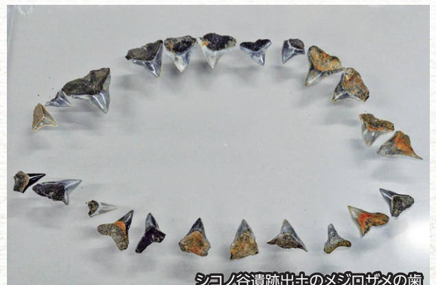
シコノ谷遺跡出土のメジロサメの歯

シコノ谷遺跡(松江市)でサメの歯が156本(日本で3番目の点数)出土し、縄文時代の食糧獲得の議論に一石を投じました。また普源田砦跡(浜田市)では、中世の山城跡を大規模に調査し、郭や竪堀などの遺構の状況を明らかにしました。