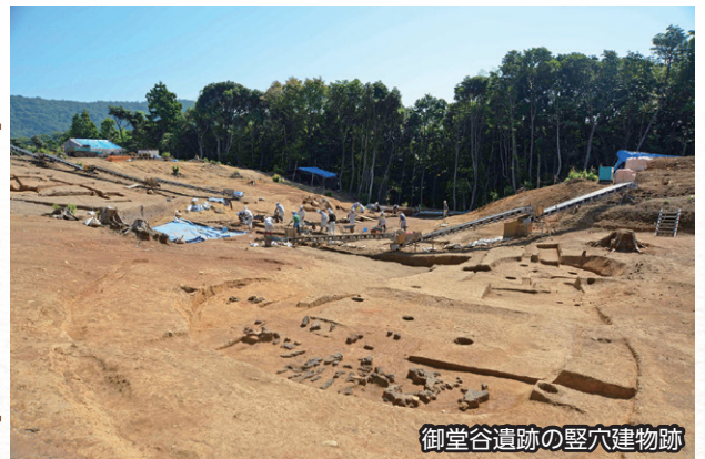
御堂谷遺跡の竪穴建物跡

静間城跡(大田市)で中世の山城を調査しました。館としての性格が強い山城として貴重な発見となりました。隣接する平ノ前遺跡では古墳時代の金銅製の飾り(空玉)が出土しました。