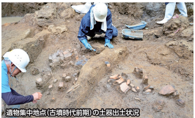
遺物集中地点(古墳時代前期)の土器出土状況