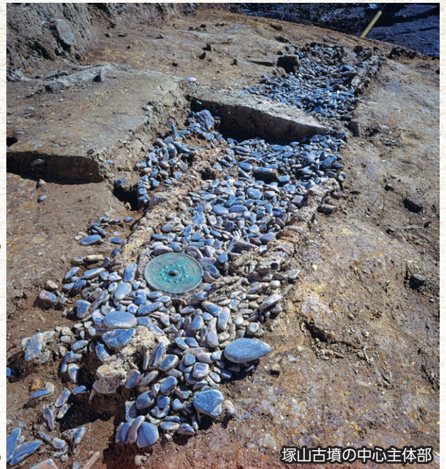
塚山古墳の中心主体部

つかやま 塚山古墳(松江市)の調査で、礫敷木棺が調査され、銅鏡や短甲(よろい)などの豪華な副葬品が出土しました。古墳は現在、団地の公園内に保存されています。