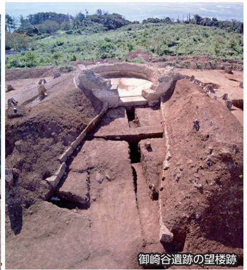
御崎谷遺跡の望楼跡