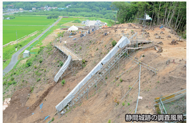
静間城跡の調査風景