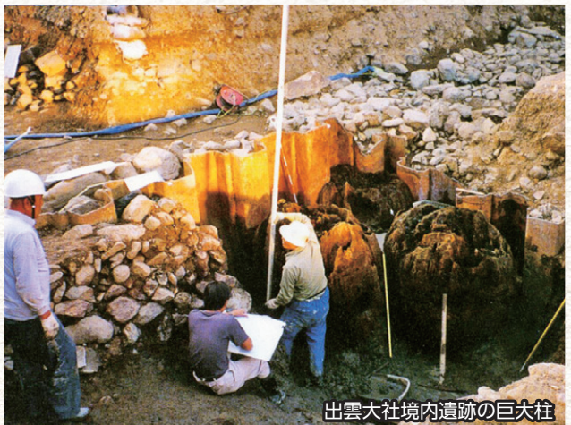
出雲大社境内遺跡の巨大柱

いずもこくふあと 史跡出雲国府跡(松江市)で30年ぶりに発掘調査が再開しました。