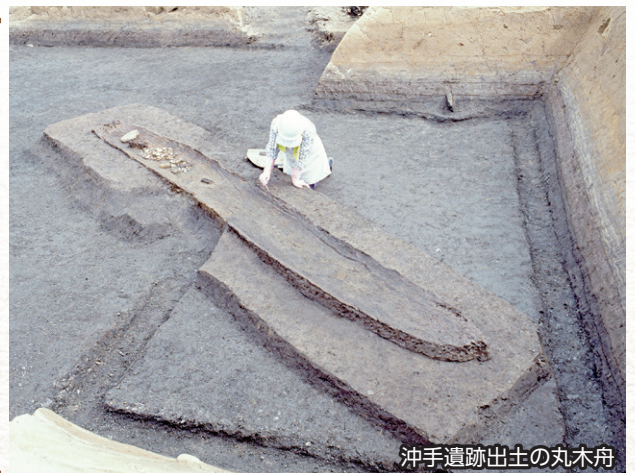
沖手遺跡出土の丸木舟

おきて 沖手遺跡(益田市)で縄文時代の丸木舟が二艘出土しました。またこの年初めて、鳥取県と共同でとっとりしまね発掘速報展を開催し、両県2会場で展示を行いました。以後平成22年度まで6回開催しました。