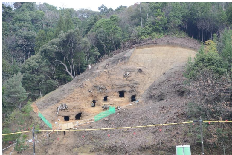
のの子谷横穴墓群

それは、中世のが横穴墓をお墓として再利用したからです。人の骨を含む古墳時代の遺物は全て外に掻き