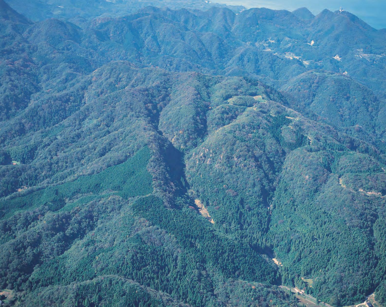
銀山柵内 上空から見た仙ノ山