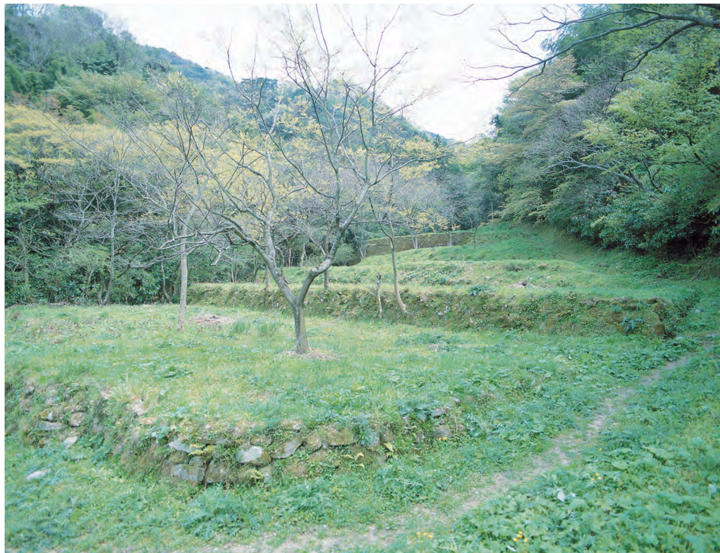
銀山柵内 柑子谷精錬所跡