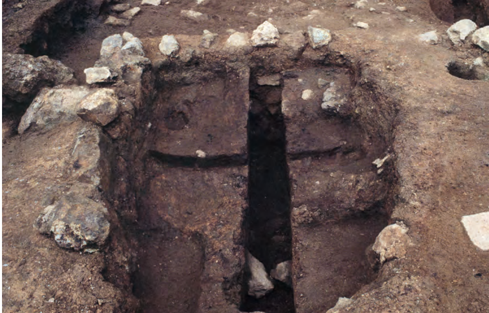
調査で確認された炉跡 (千畳敷地区)