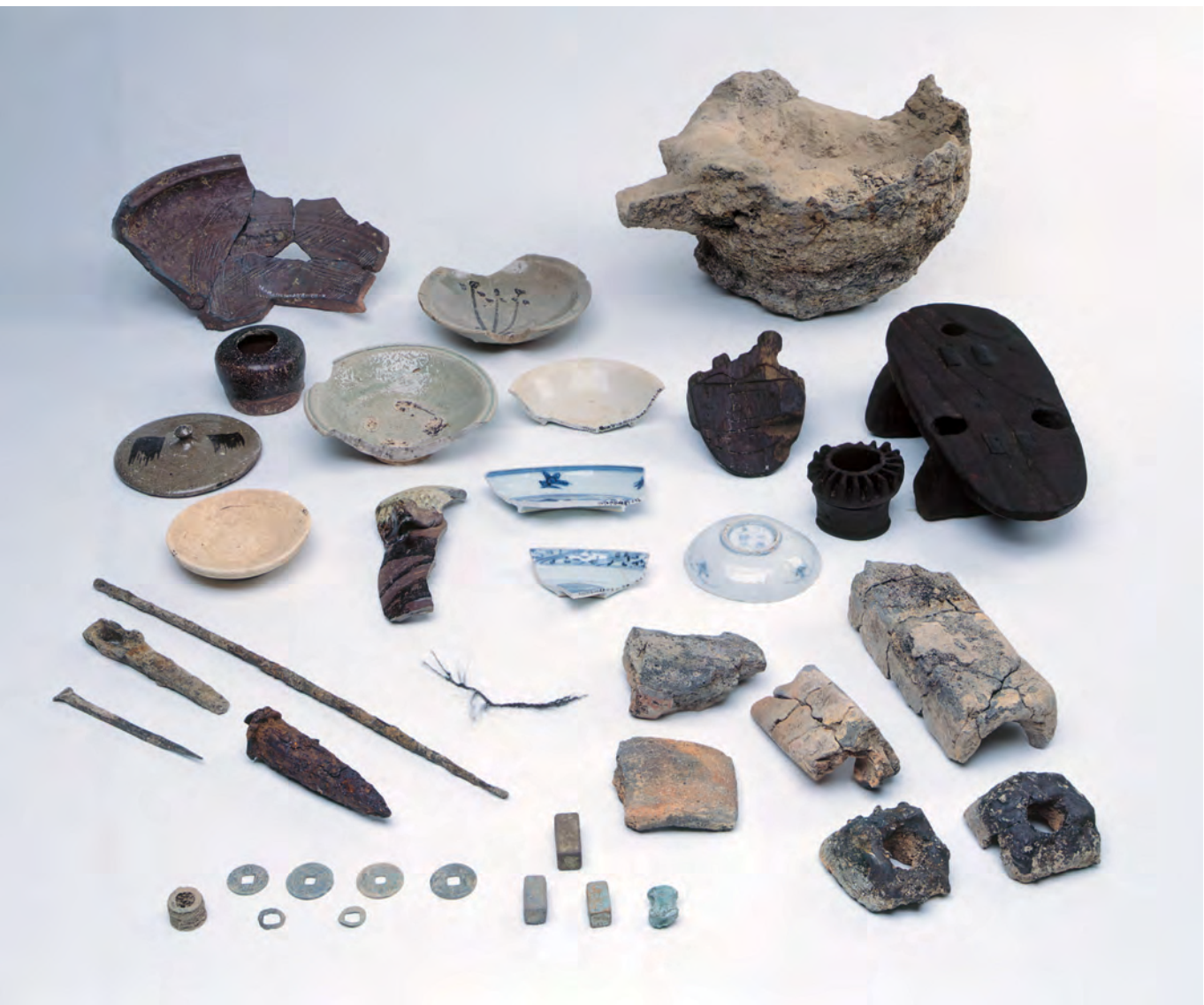
出土遺物 生産遺物と生活遺物（石銀藤田地区）