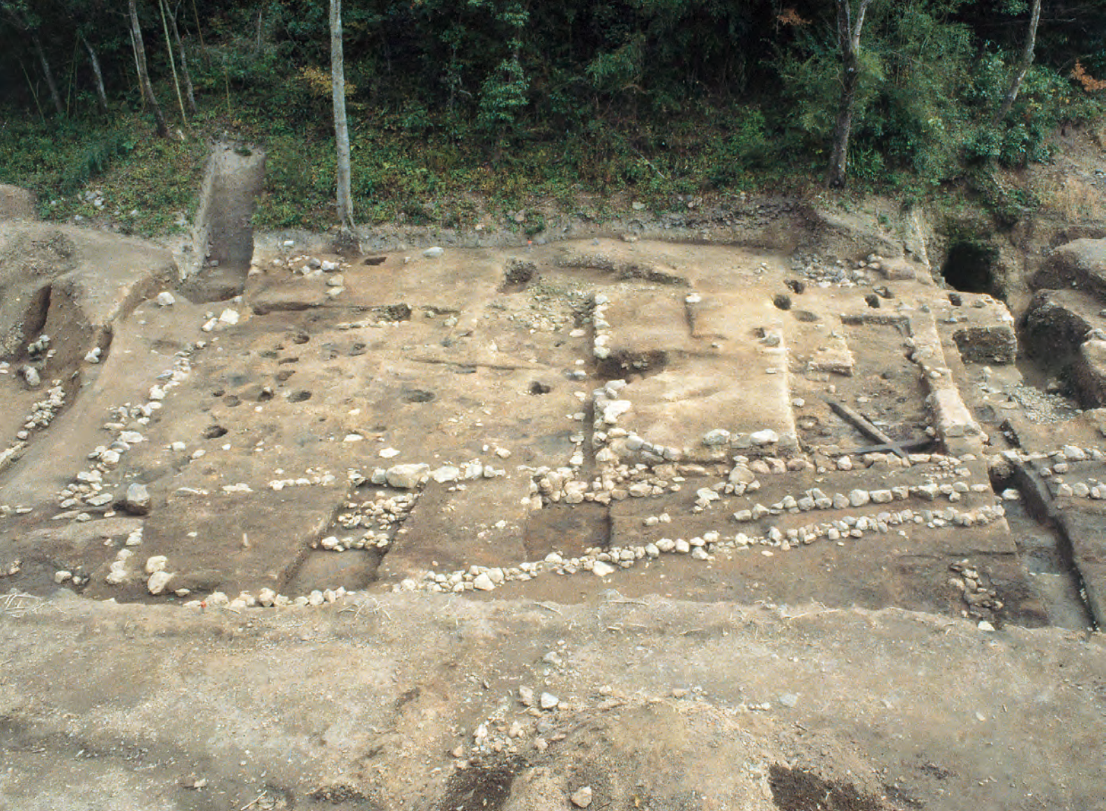
銀山柵内 1998年に調査された作業場跡（石銀藤田地区）