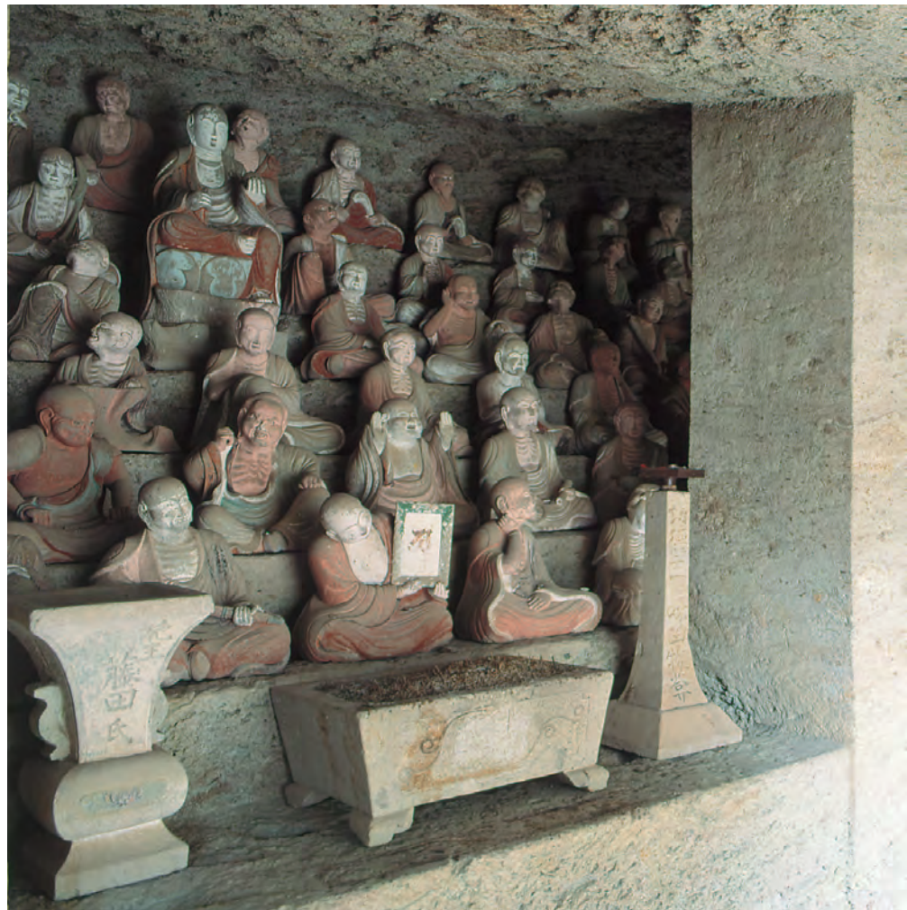
大森・銀山 羅漢寺石窟内の羅漢坐像