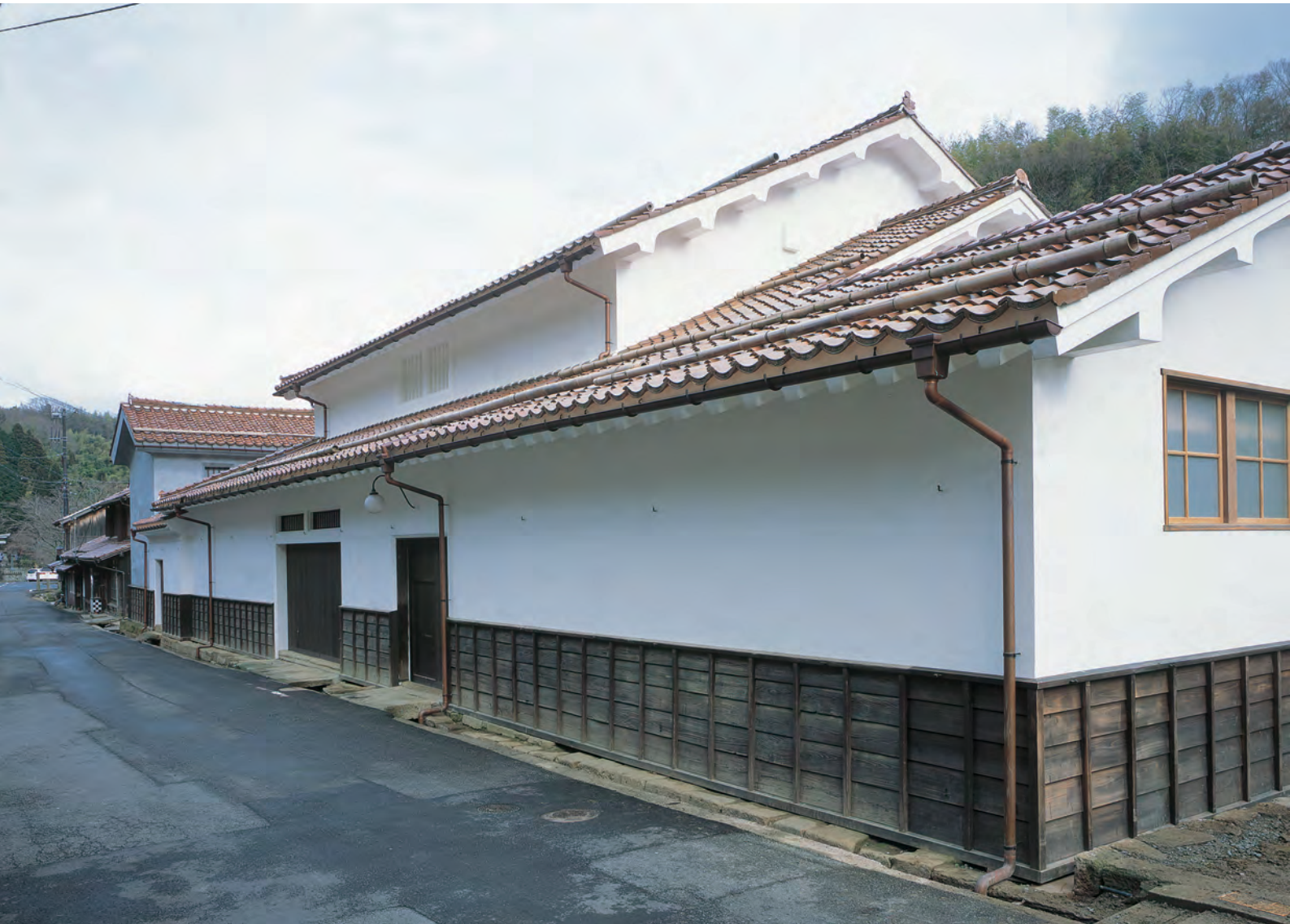
大森・銀山 熊谷家住宅（外観）