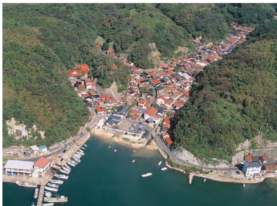
温泉津 温泉津の町並み