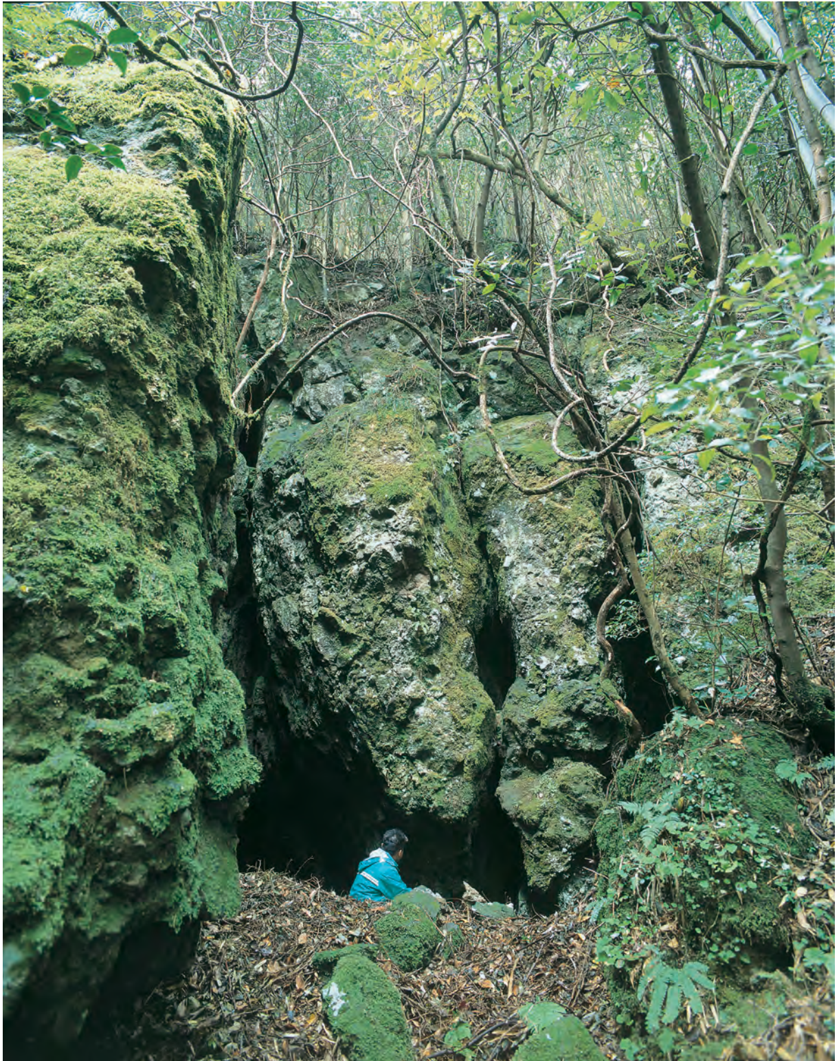
銀山柵内 樋押掘り跡