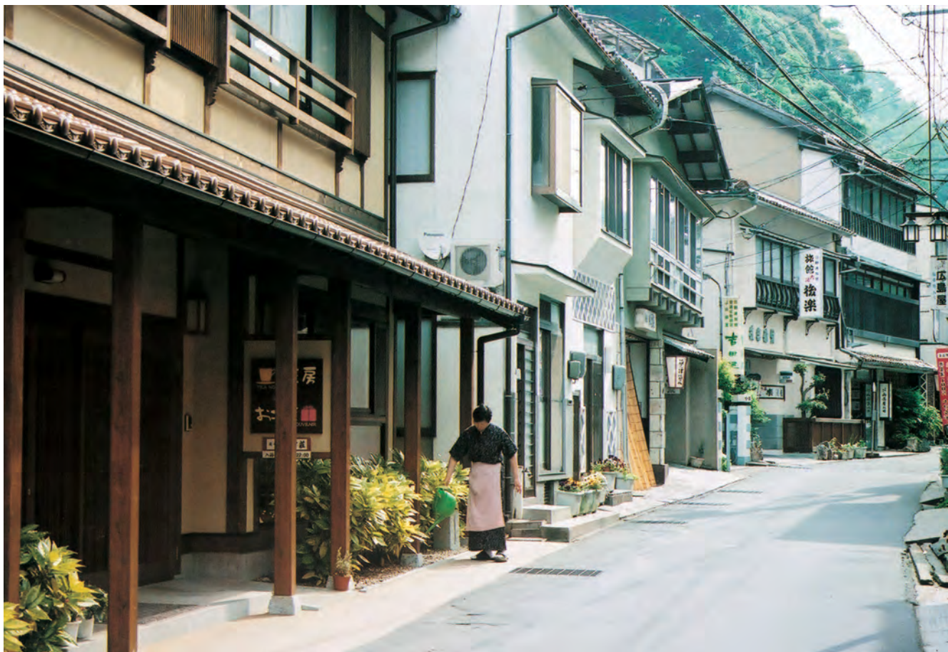
温泉津 旅館が建ち並ぶ歴史的な町並み