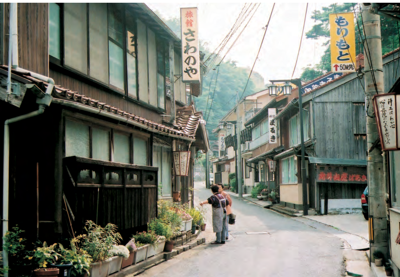
温泉津 旅館が建ち並ぶ歴史的な町並み