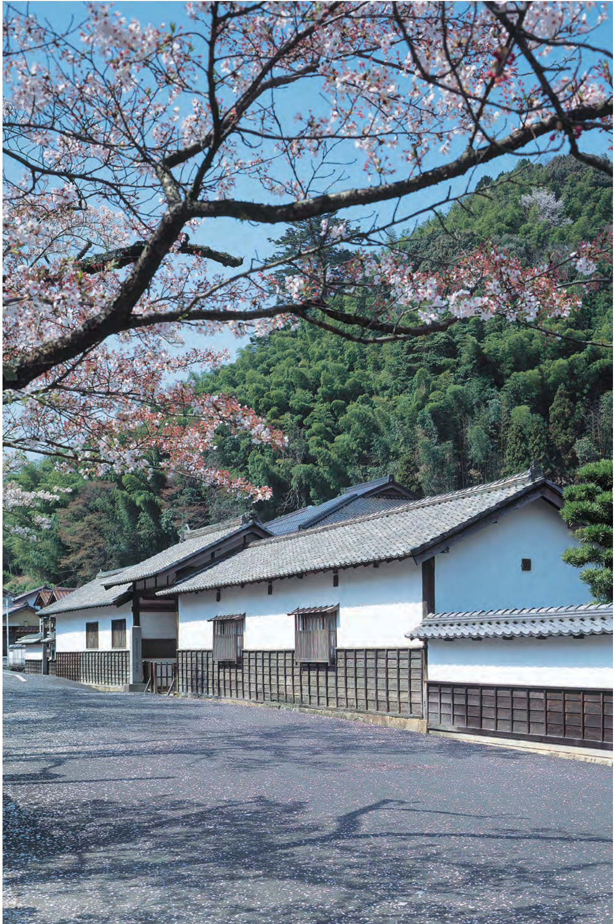
大森・銀山 代官所跡