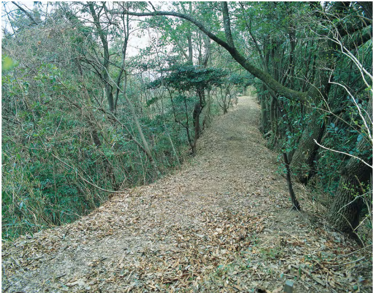
石見銀山街道 鞆ヶ浦道