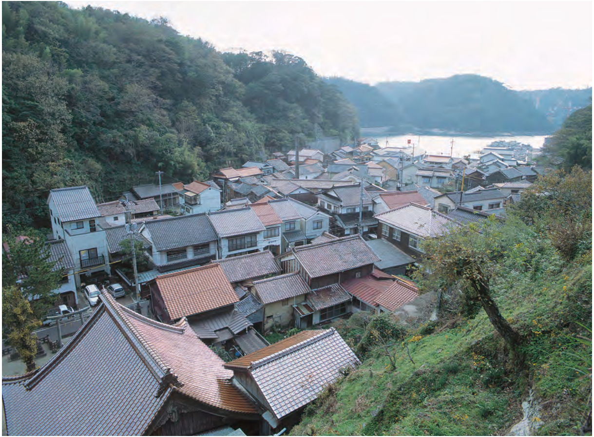
温泉津 温泉津の町並み