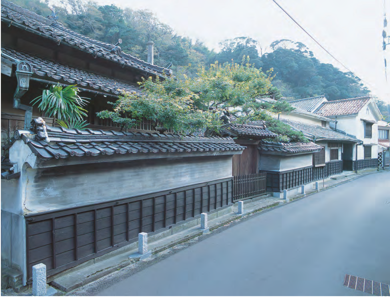
温泉津 旧廻船問屋屋敷 (内藤邸)