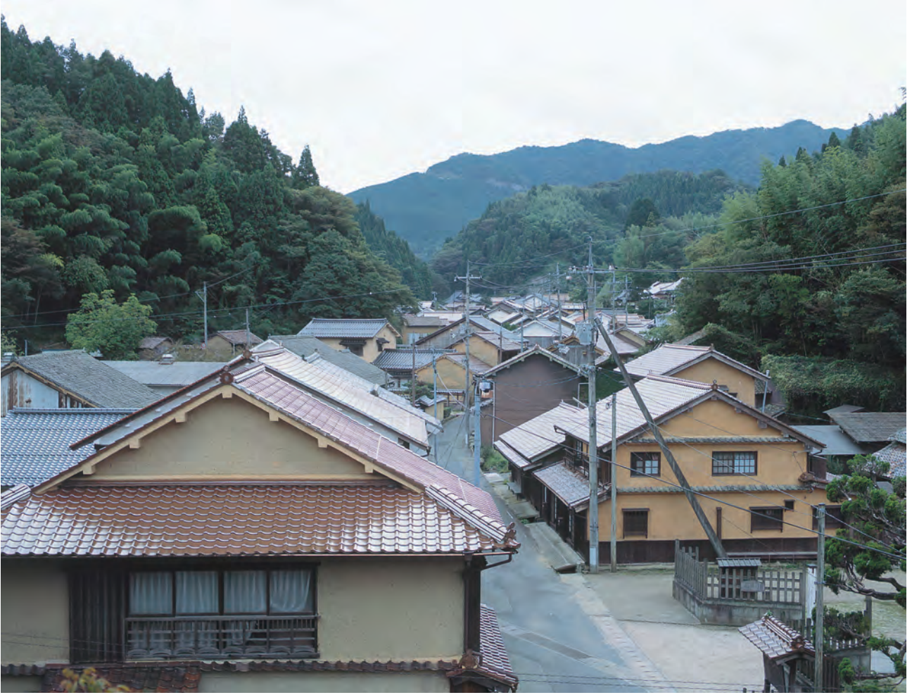
大森・銀山 大森地区の歴史的な町並み