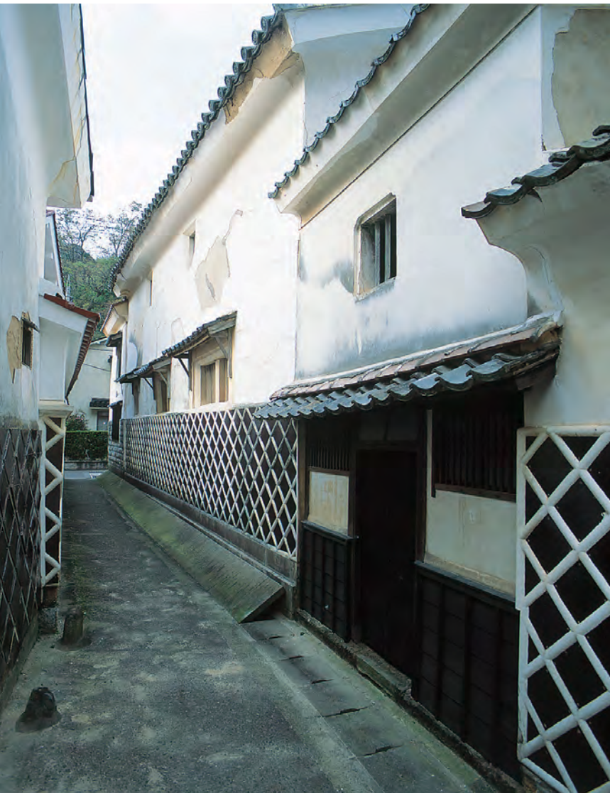
温泉津 旧廻船問屋屋敷