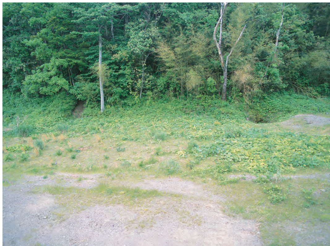
銀山柵内 現在の様子（石銀藤田地区）