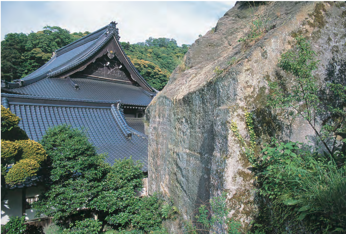
温泉津 寺院と岩盤