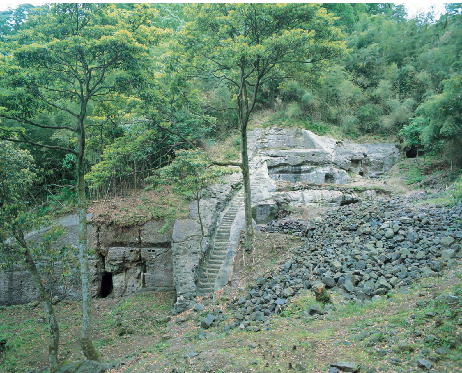
銀山柵内 釜屋間歩と岩盤加工遺構（本谷地区）