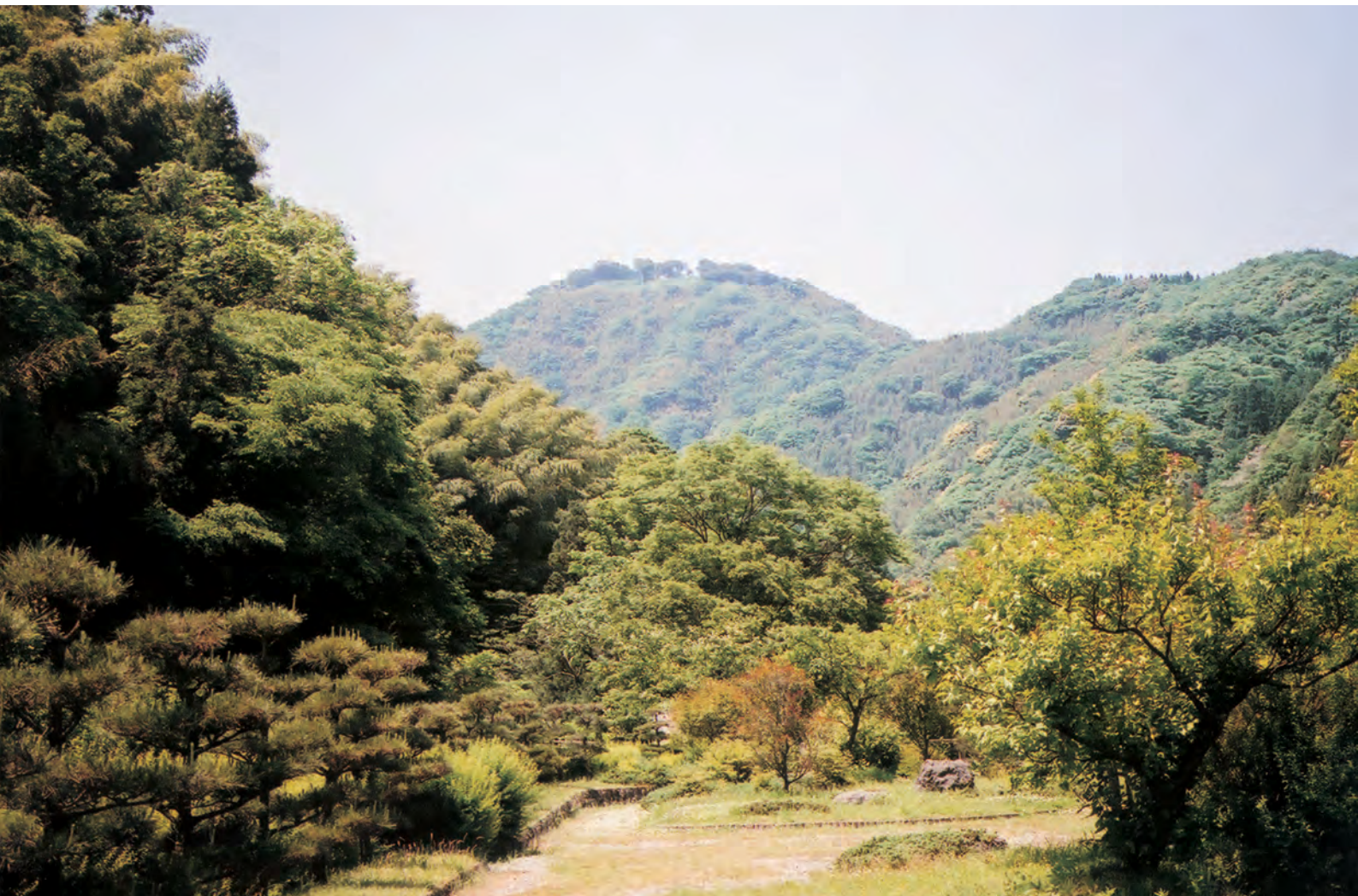
銀山柵内 大森銀山地区から見た山吹城跡