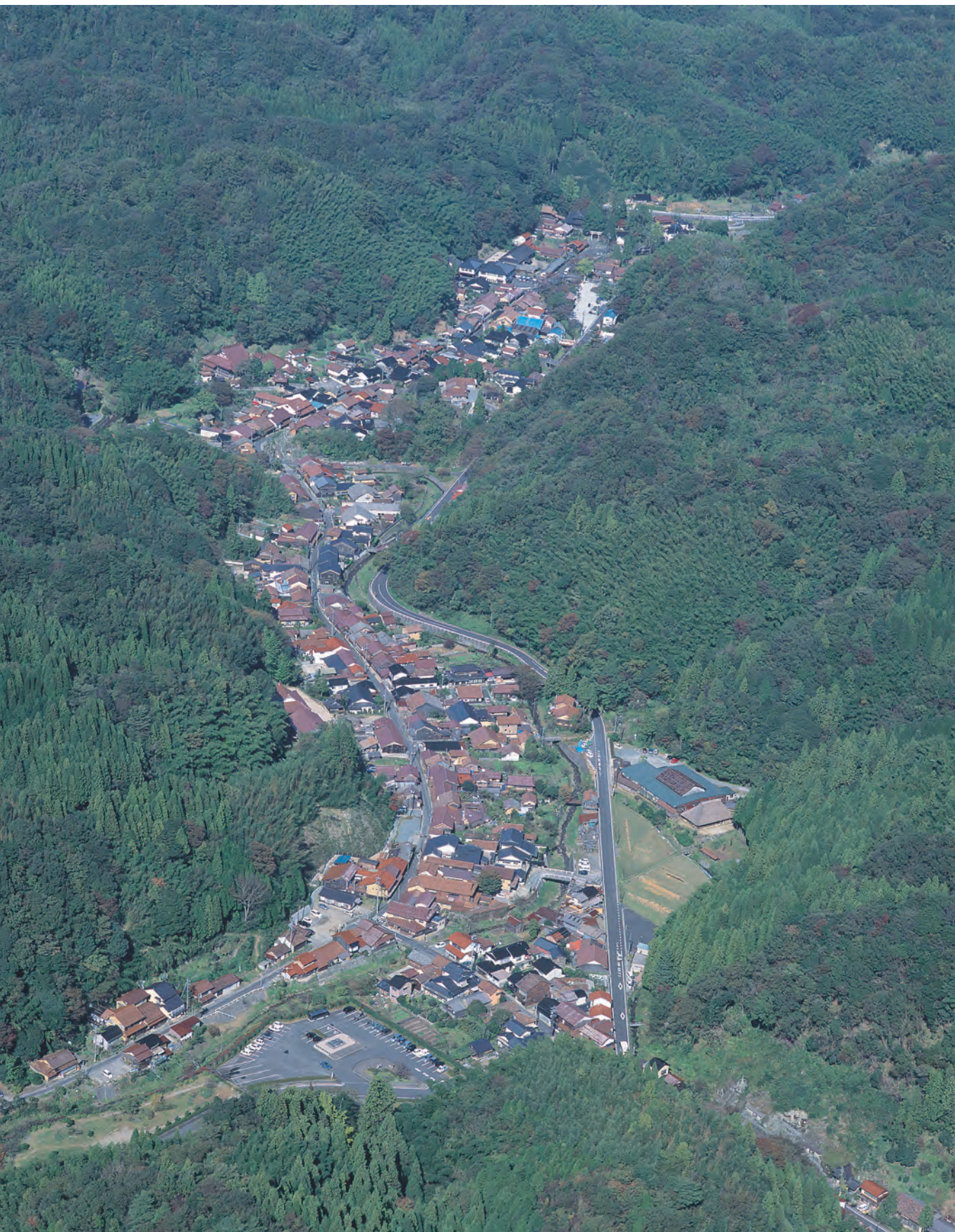
大森・銀山 上空から見た大森の町並み