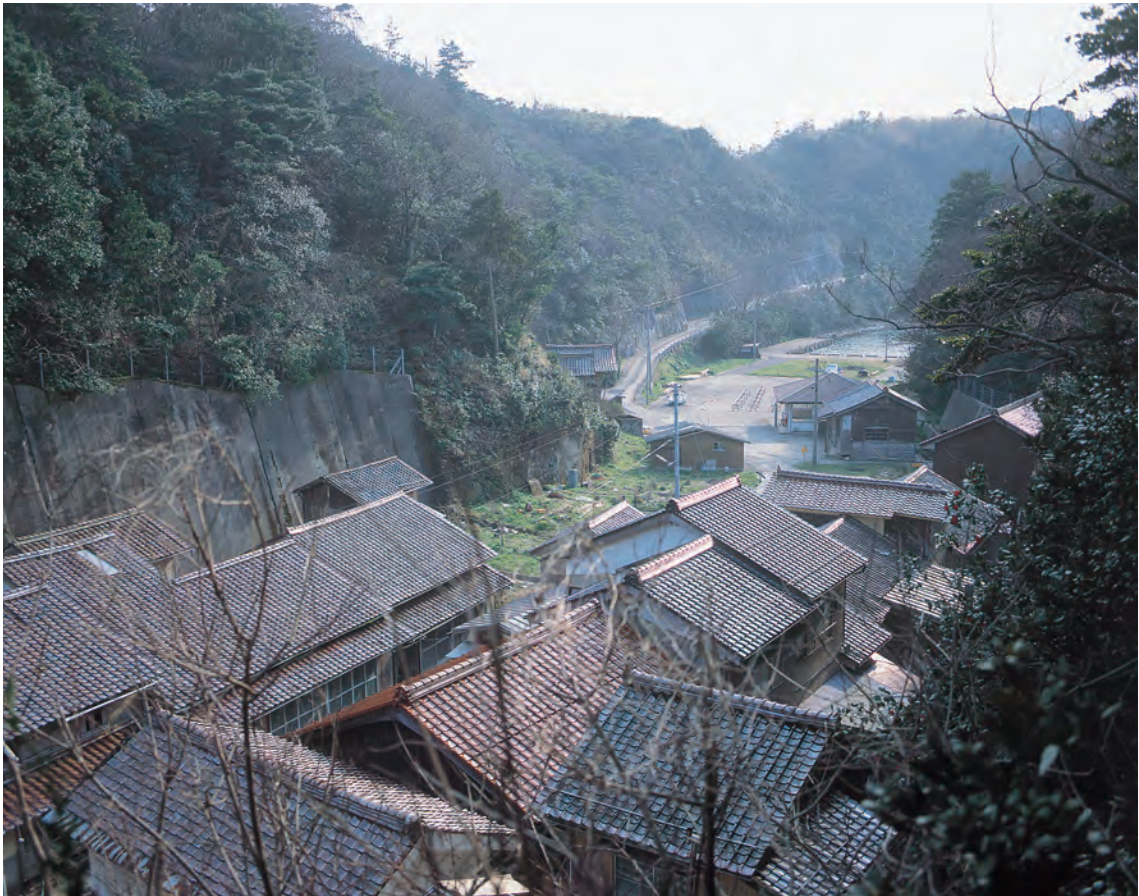
沖泊 沖泊の町並み（北東から）