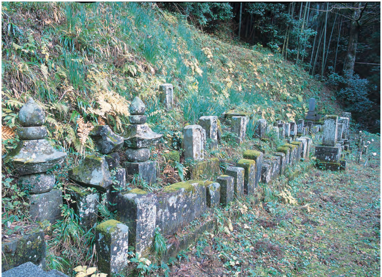
銀山柵内 妙正寺跡