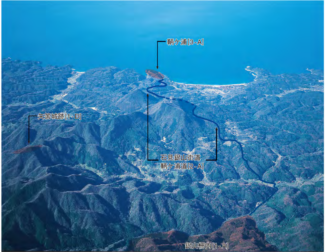
上空から見た石見銀山街道 鞆ヶ浦道