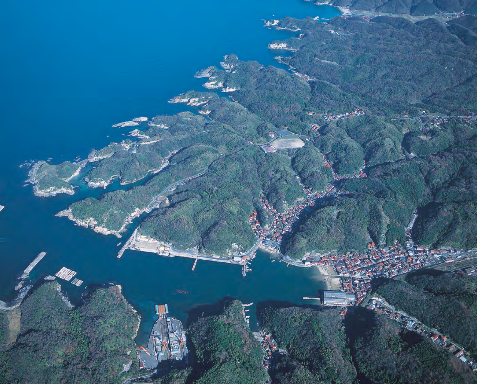
上空から見た温泉津