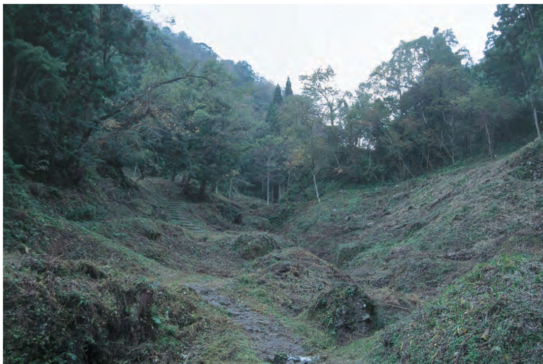
銀山柵内 本谷の様子