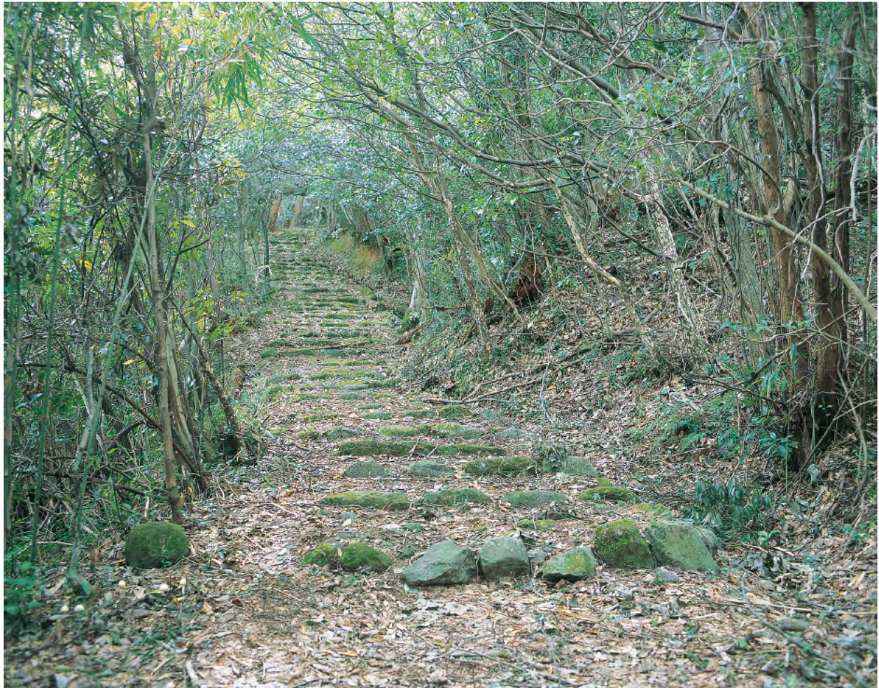
石見銀山街道 温泉津沖泊道