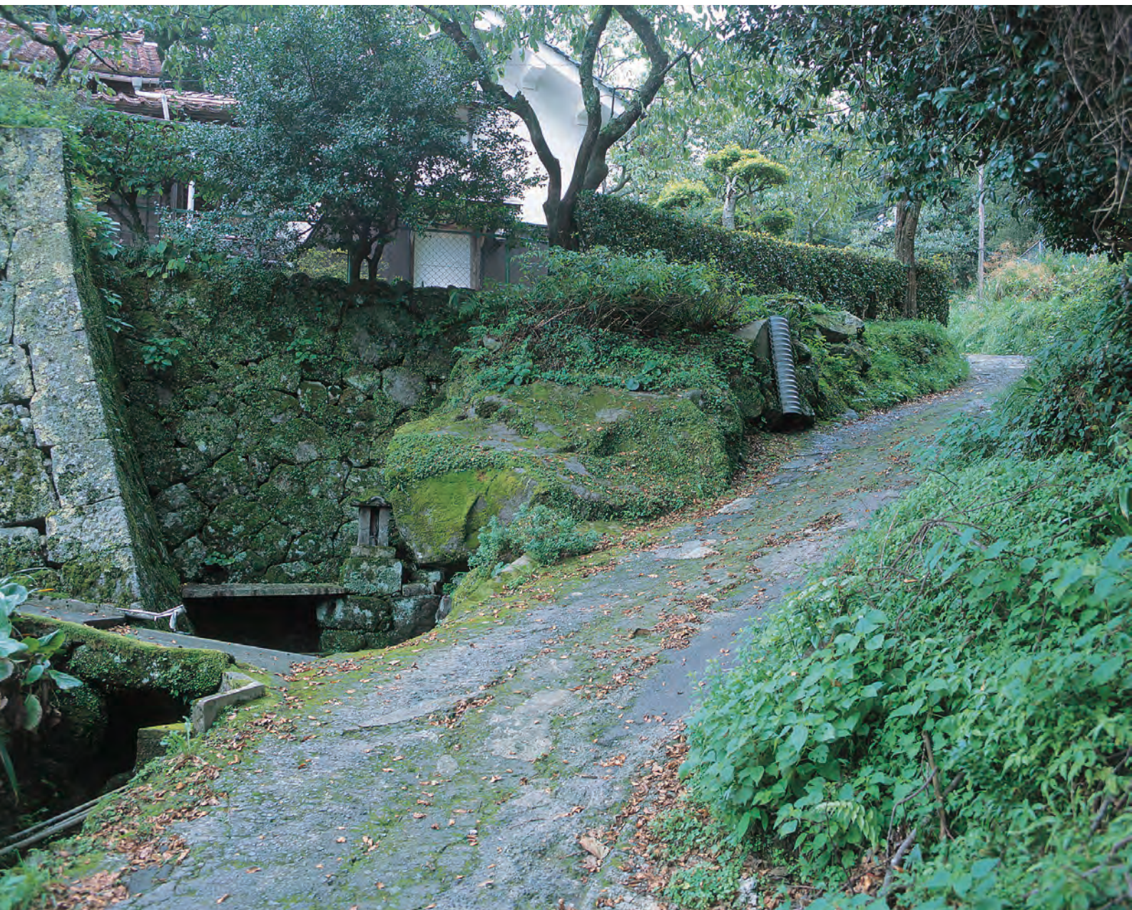
石見銀山街道 温泉津沖泊道 清水の金柄杓 かなびしやく