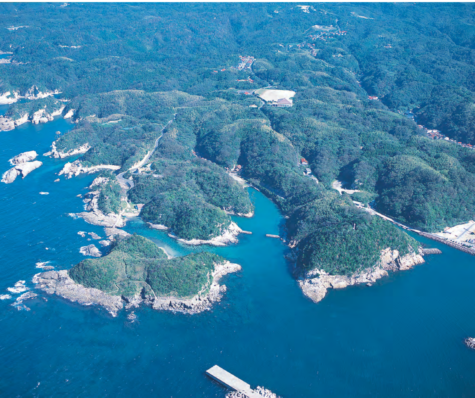
上空から見た沖泊