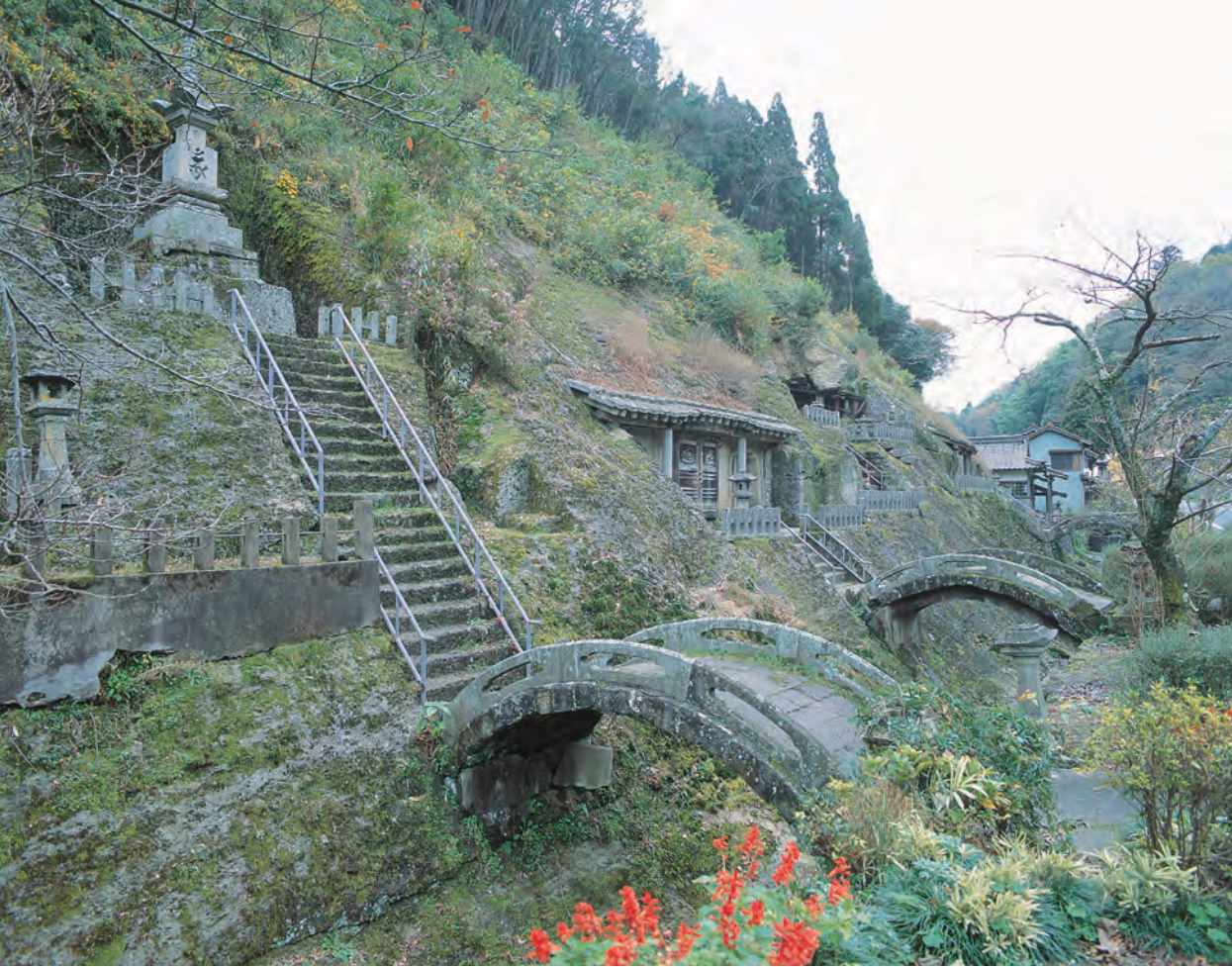
大森・銀山 羅漢寺五百羅漢