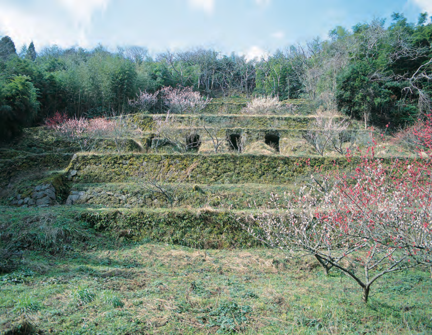
銀山柵内 清水谷精錬所跡