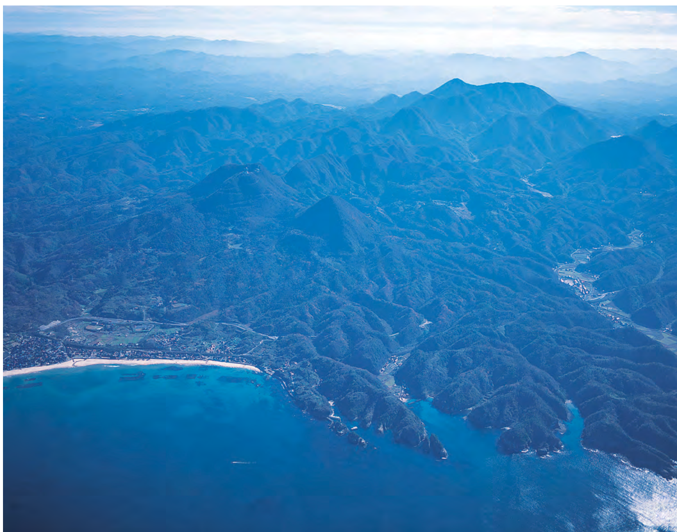
上空から見た石見銀山（北西から）