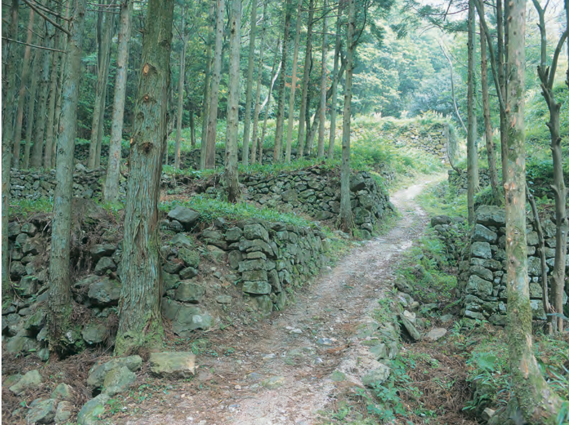
銀山柵内 銀山柵内に残る平坦地