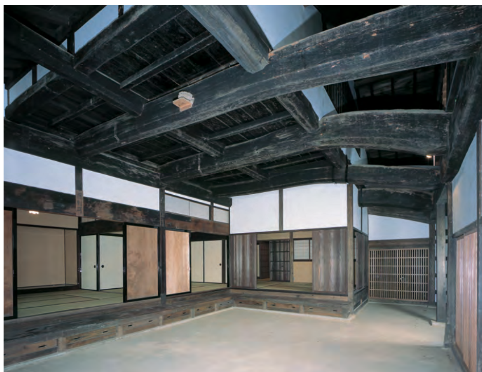
大森・銀山 熊谷家住宅（内部）