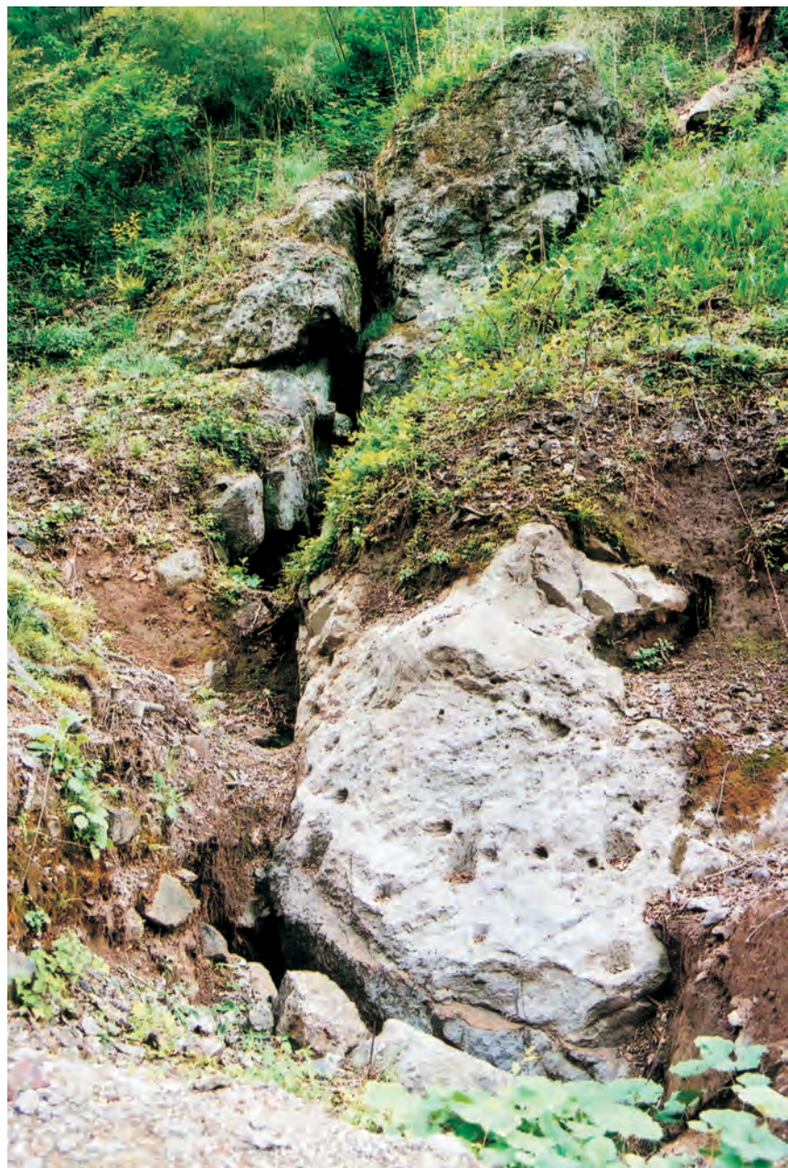
銀山柵内 樋押掘り跡