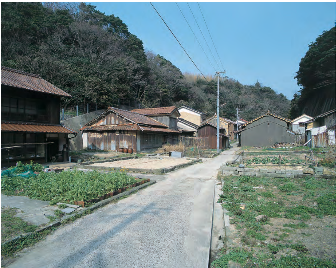
沖泊 沖泊の町並み（南西から）