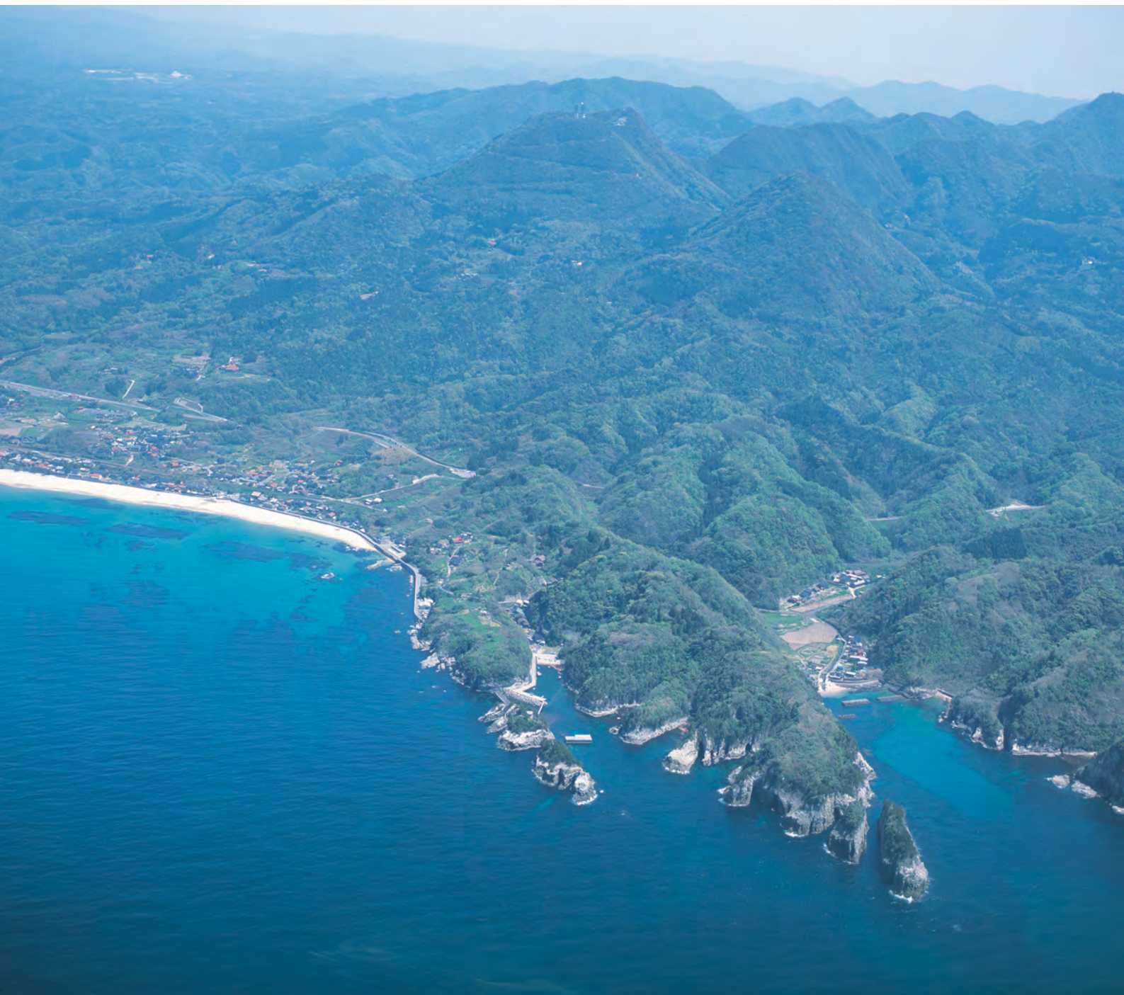
上空から見た鞆ヶ浦 ※中央の入り江が鞆ヶ浦