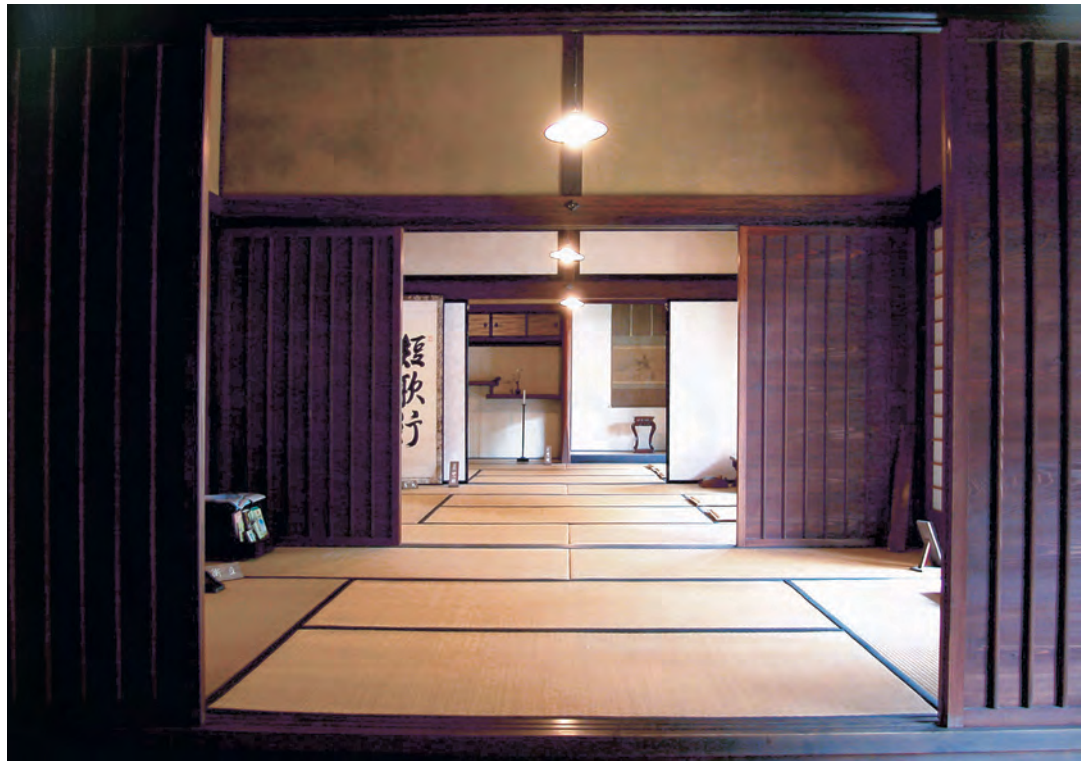
大森・銀山 旧河島家（内部）