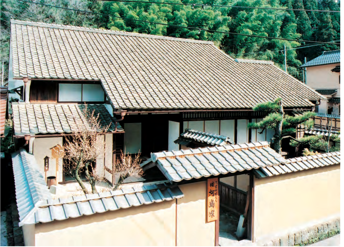
大森・銀山 旧河島家（外観）