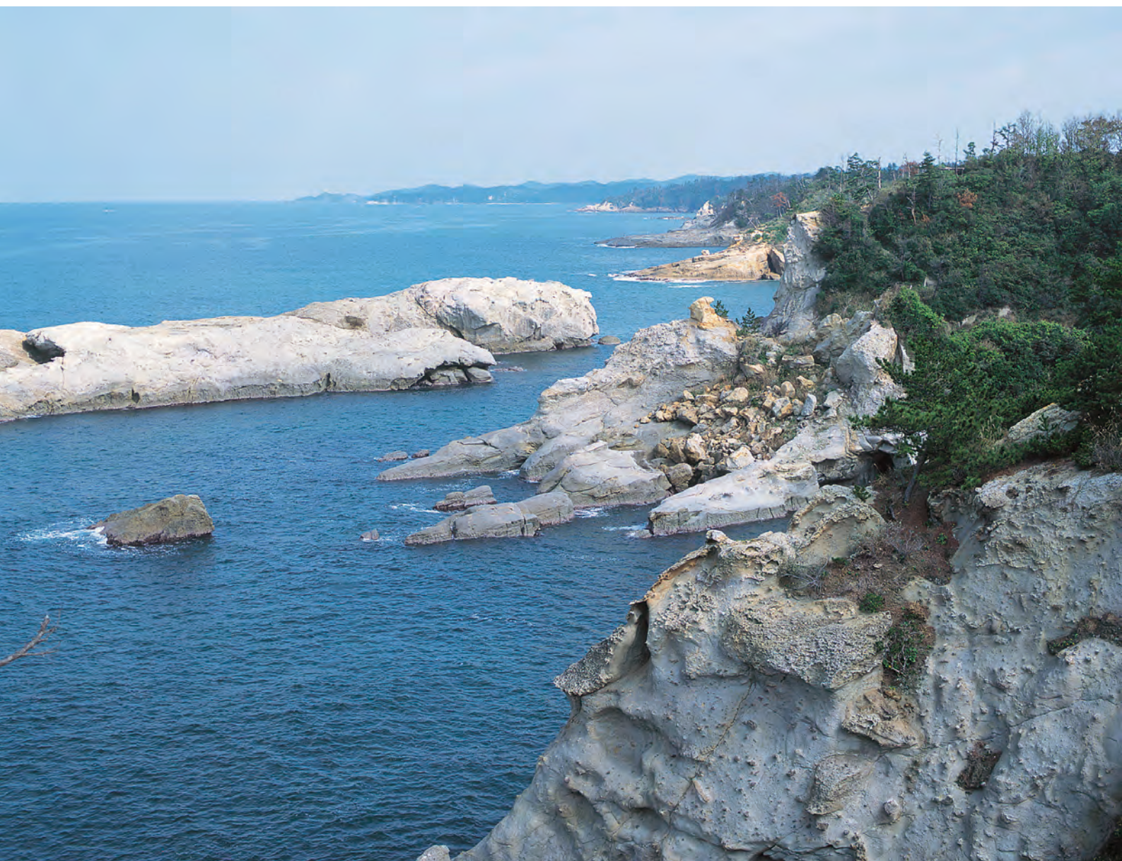
緩衝地帯における海岸線