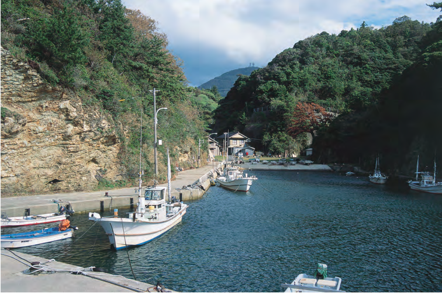
鞆ヶ浦 鞆ヶ浦の港