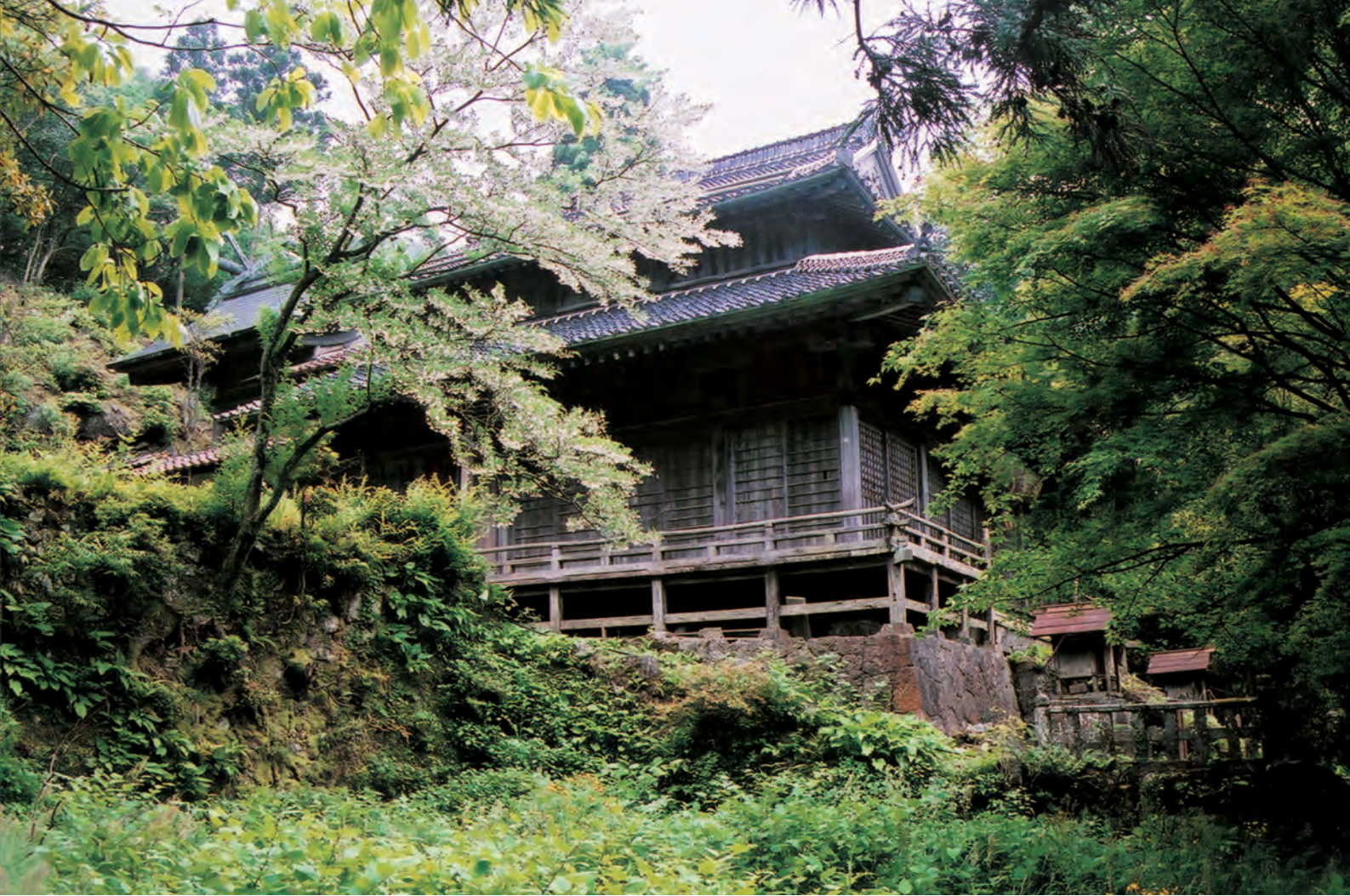
銀山柵内 佐毘売山神社