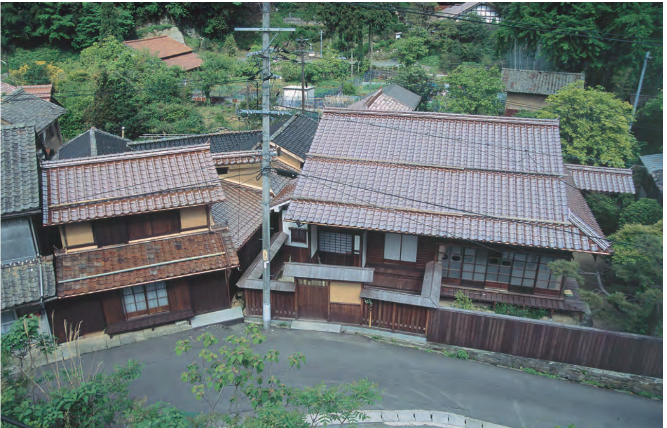
大森・銀山 隣り合う武家屋敷と町屋