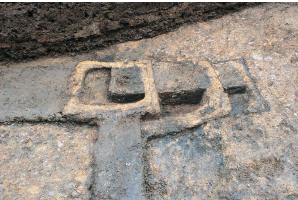
調査で確認された炉跡 (竹田地区)