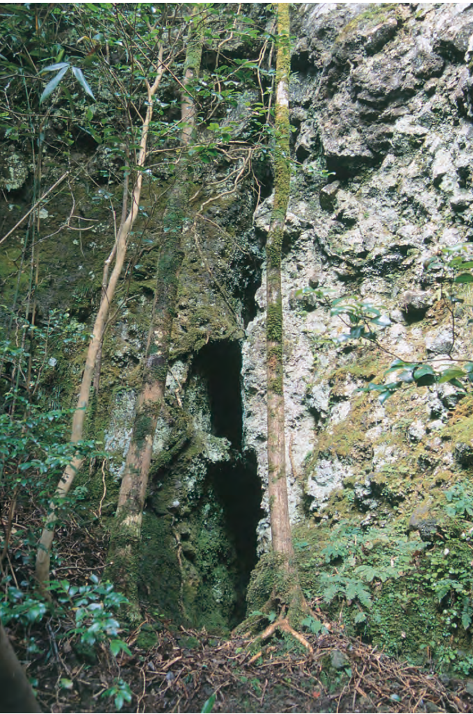
銀山柵内 樋押掘り跡