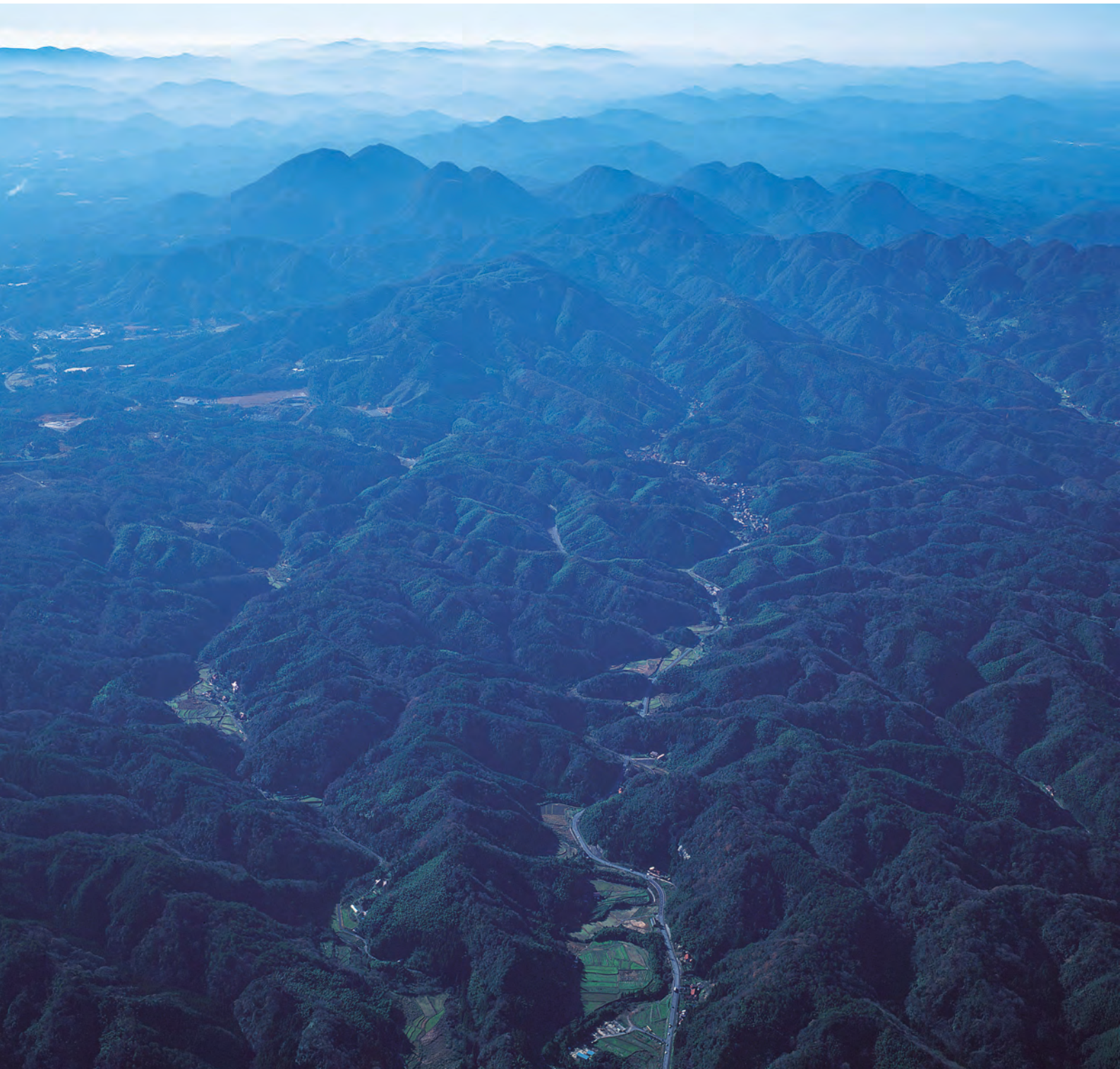
上空から見た仙ノ山と大森の町並み