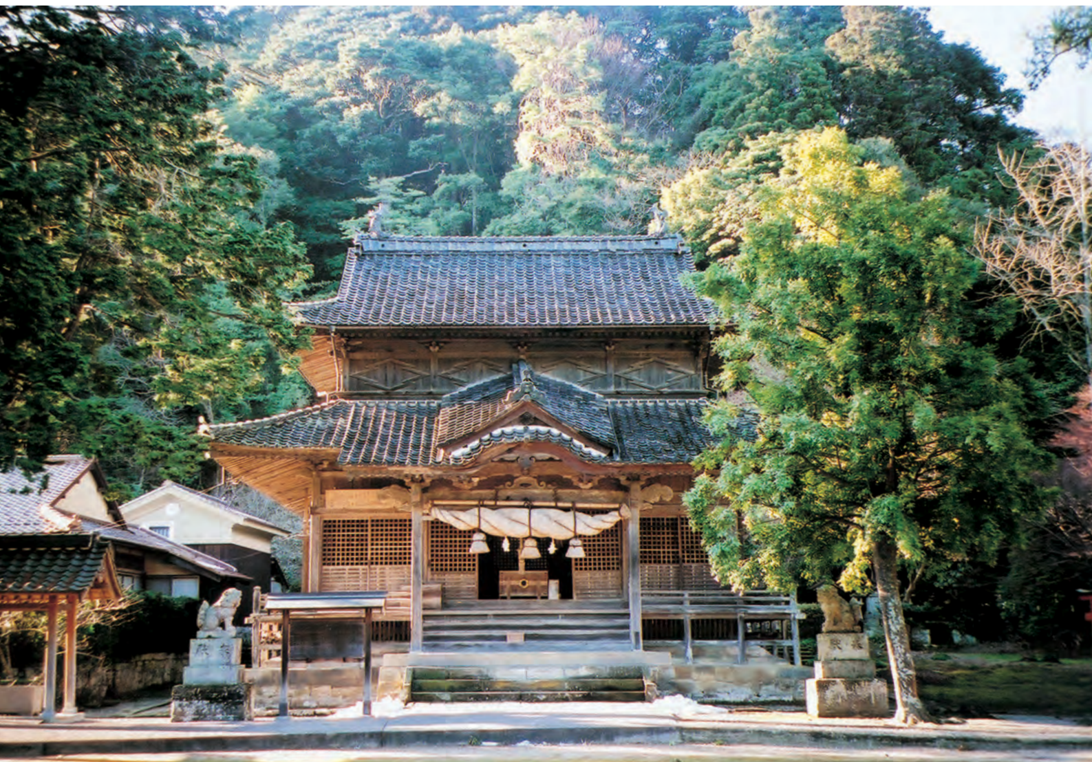
大森・銀山 城上神社