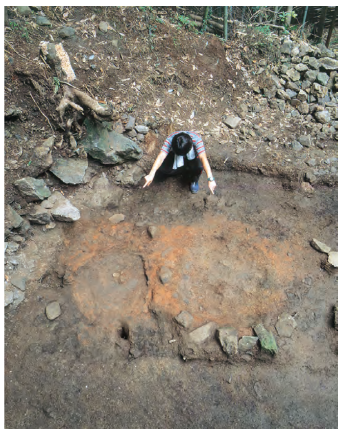
調査で確認された炉跡 (出土谷地区)