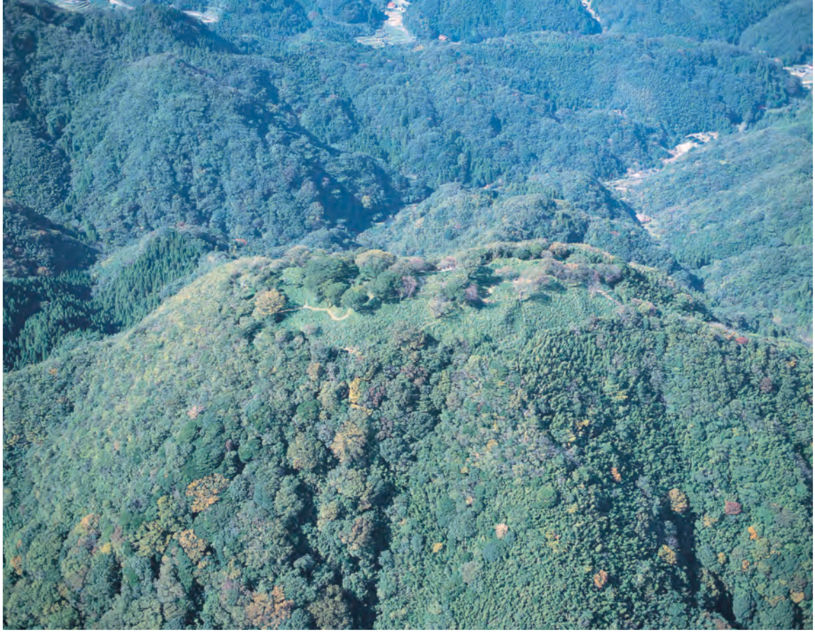
銀山柵内 上空から見た山吹城跡