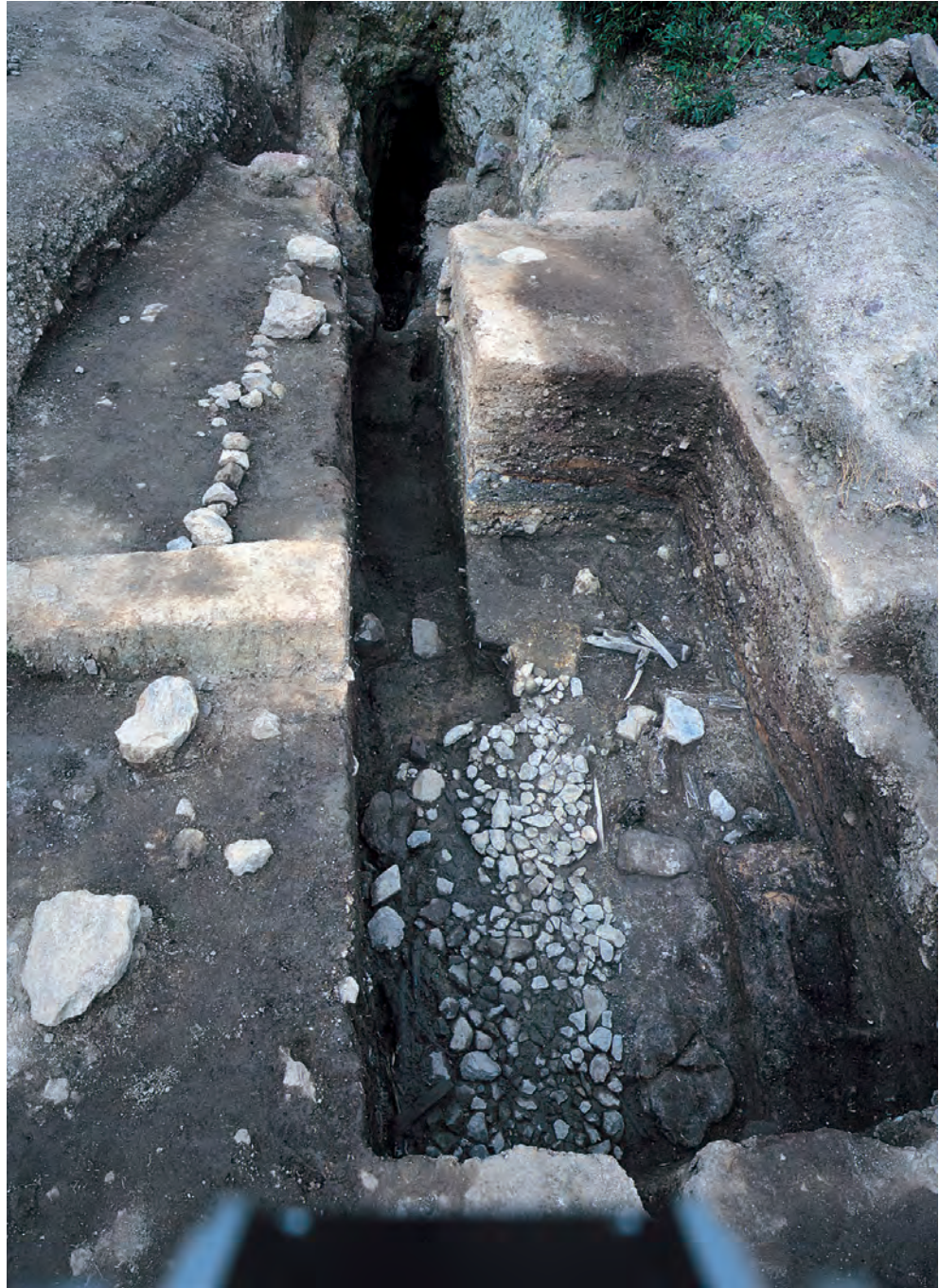
銀山柵内 坑道入り口と鉄鍋出土地点（石銀藤田地区）