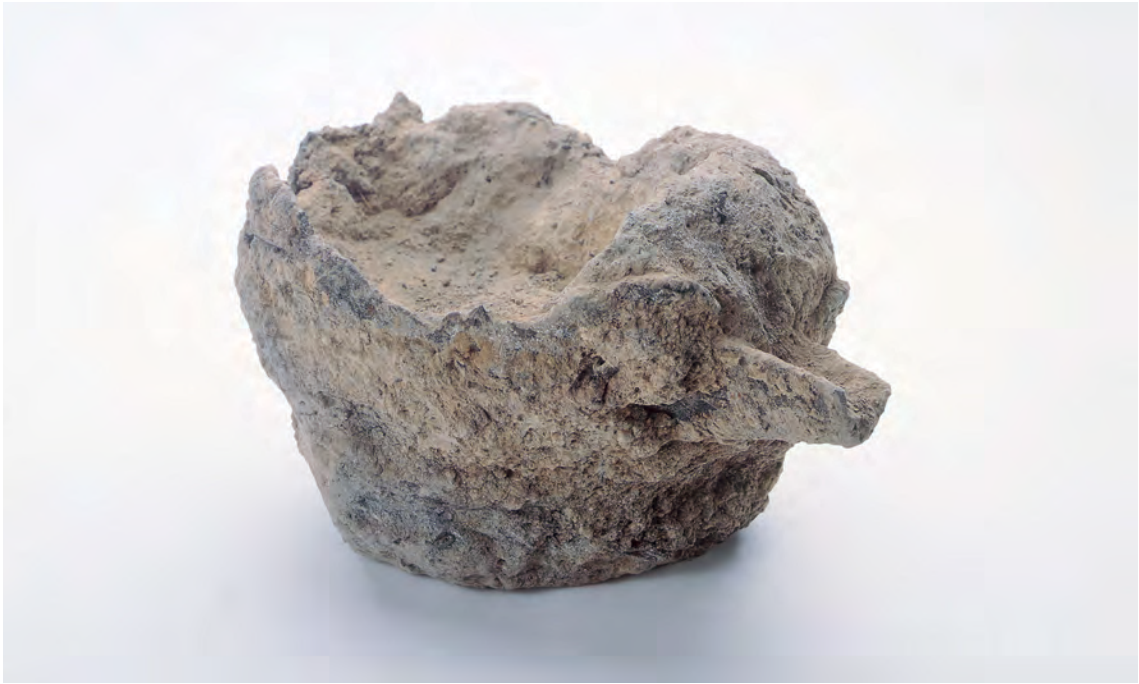
出土遺物 鉄鍋（石銀藤田地区）