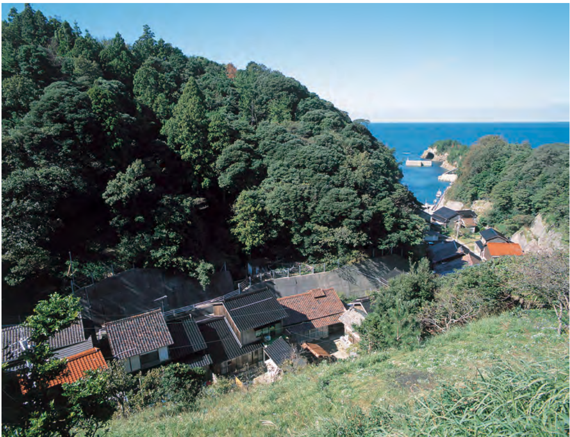
鞆ヶ浦 鞆ヶ浦の町並み