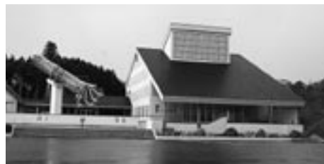
奥出雲たたらと刀剣館