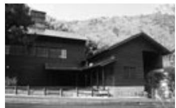
たたら角炉伝承館