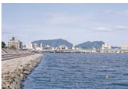
松江千鳥町の宍道湖岸から見た嵩山、和久羅山。右の和久羅山が人の顔に見える。

布自積美烽は、嶋根郡家の正南七里二百一十歩なり。 松江市西川津町の東方にそびえる嵩山(三三三m)、旅伏山と対になって宍道湖東岸にそびえる目立つ山。国庁につなぐ重要な烽だが、隠岐航路からも嵩山を見ることができ、隠岐との