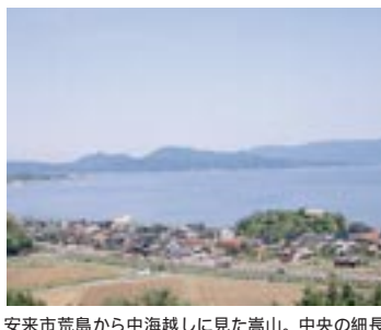
安来市荒島から中海越しに見た嵩山。中央の細長い山が嵩山で、その右に飛び出した峰を女岳山にあてる説もある。東からも西からもよく見える山だ。

布自積美高山。郡家の正南七里二百一十歩なり。高さ二百七十丈、周り一十里なり。烽あり。 女岳山。郡家の正南二百三十歩なり。 女岳山は、布自積美烽である嵩山の南にそびえる和久羅山(二二八二m)とする説と、嵩山の北側に突き出した峰である女岳とする説がある。嵩山と和久羅山は松江市橋北から眺めると人が寝ころんでいる形(和久羅山が顔、嵩山が胸)に見えるため、「ガリバー山」との異名もある。