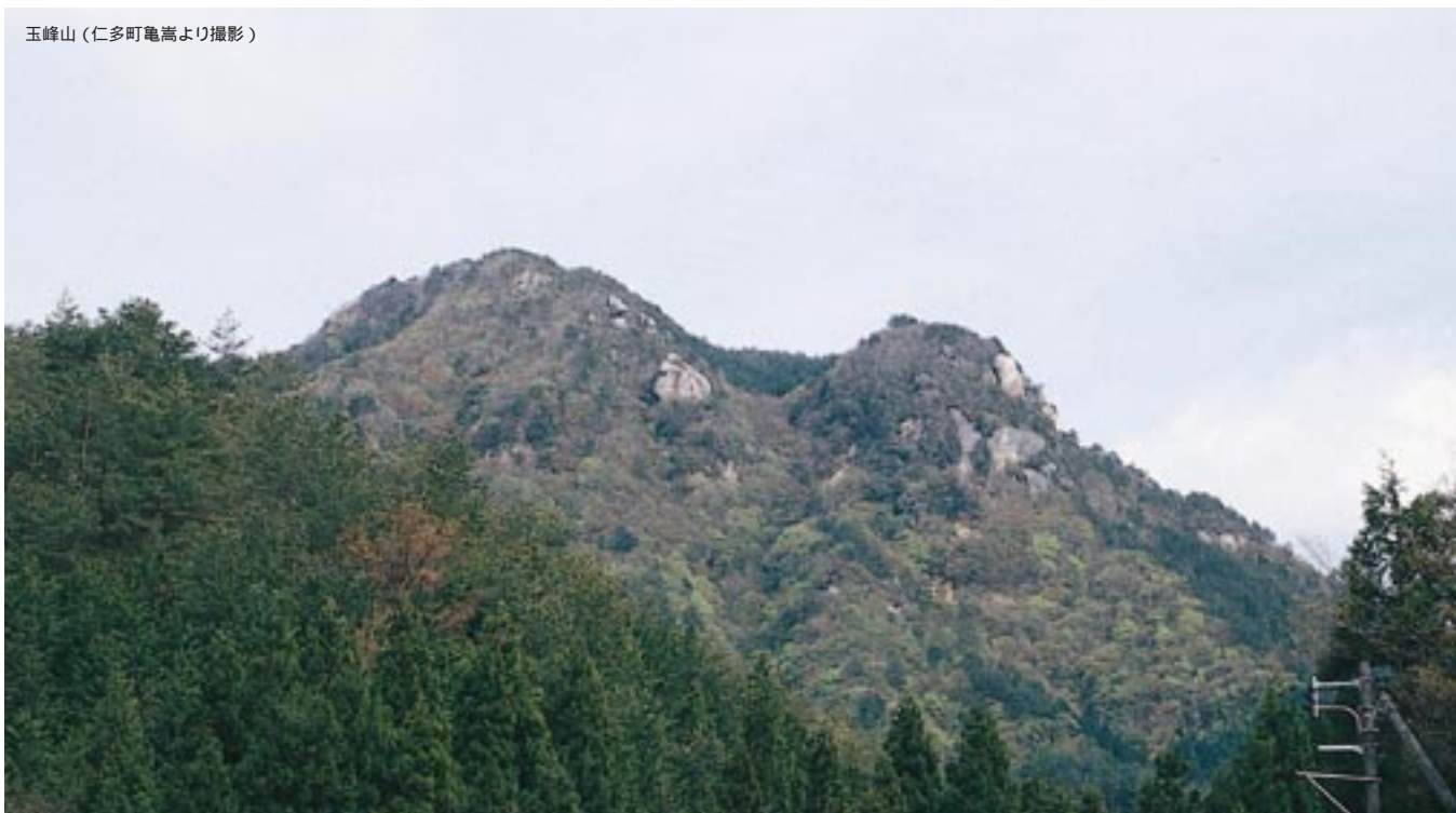
玉峰山(仁多町亀高より撮影)

玉峰山。郡家の東南一十里なり。古老の傳へに云へらく、山嶺に玉上神を在せまつ。故、玉峰と云ふ。 仁多町亀高の玉峰山(八二〇m)山には巨岩や奇岩が露出し、また雄滝、雌滝をはじめとする多くの滝もあり、神を祀るにふさわしい山。現在ふもとに森林公園が整備されている。