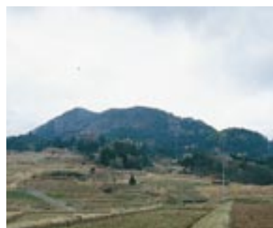
大袋山(出雲市稗原町より撮影)

菅火野。郡家の正西四里なり。高さ一百二十五丈、周り一十里あり。峯に神社あり。 仁多町三所の北の城山(五七八m)と考えられる。これも郡家からよく見えた山である。