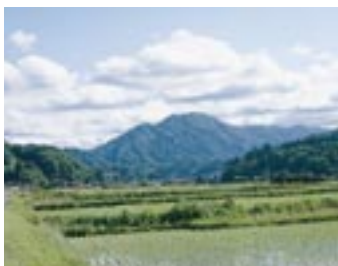
鯛ノ巢山(仁多町下阿井より撮影)

志努坂野。郡家の西南三十一里なり。紫草少しくあり。 猿政山の西の鯛ノ巢山(二〇二六)と考えられている。ふもとには、角灯伝承館がある。