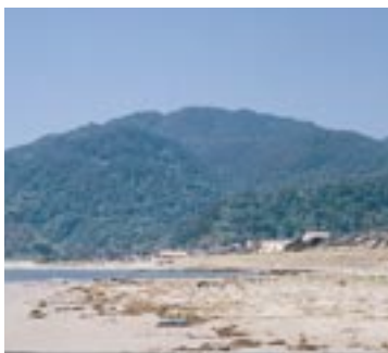
出雲郡家の西北三十二里 馬見峰は、出雲郡家の西北三十二里二百四十歩なり。