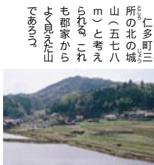
城山(仁多町高田より撮影)

仁多町三成の、鬼の舌震がある山。ワニサメがこのあたりにいる玉日女命に恋をして、川を上って来たところ、わにの恋ふる。が変化して鬼の舌震になったと伝えられる。鬼の舌震は馬木川の中流にある巨岩・奇岩が並ぶ大渓谷で、国の名勝天然記念物に指定されている。