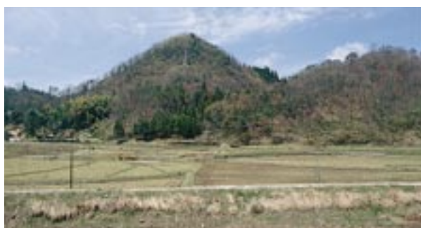
大内野が(J R亀高駅付近より撮影)

仁多町亀高大内野の北にある低い山とされている。郡家(郡の役所)に近いため、記されたのだらう。