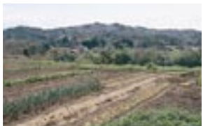
横田町大曲の山(横田町大曲より撮影)

御坂山。郡家の西南五十三里なり。即ち此の山に神の御門あり。故、御坂と云ふ。備後と出雲との堺なり。鹽味葛あり。 仁多町阿井の奥、広島県境の猿政山(二二六七)と考えられている。西側のふもとには、近世以来たたら製鉄を営んできた桜井家の邸宅や可部屋集成館がある。 城継野。郡家の正南一十里なり。紫草少しくあり。