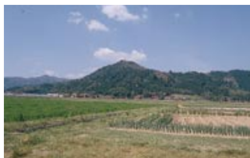
車山。左は京羅木山(安来市田頼町より撮影)

暑垣烽は、意宇郡家の正東二十里八十歩なり。 安来平野の西、安来市飯梨町の車山(二〇七m)と考えられている。標高はさほど高くないが、平野に突き出した山だけに、安来市内や広瀬町方面からもよく目立つ。