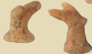
石田遺跡出土 (安来市吉佐町)