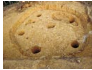
安来市・越峠遺跡 (弥生時代後半～弥生時代終り)