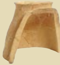
よつぎニ 四ツ廻り遺跡出土 (八束郡東出雲町)