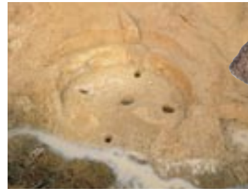
安来市・宮内遺跡 (弥生時代中ごろ)