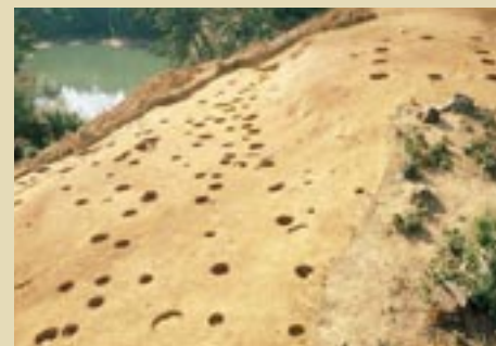
オノ峠遺跡(松江市竹矢町) たくさんの柱穴は、この斜面に掘立柱建物があったことを示す。