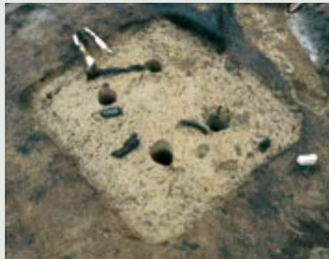
飯石郡頓原町の森遺跡で発掘された、カマドを備えた住居跡。石を組んで、カマドの骨組みを作った様子がよくわかる。とって付いた甕(土製の蒸し器)も見つかっている。