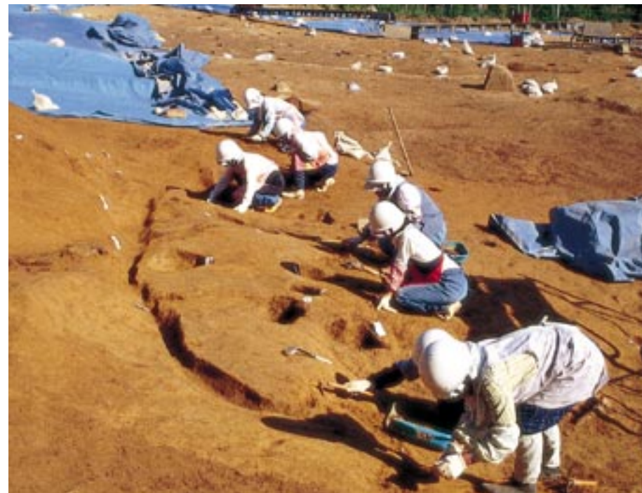
住居跡の発掘作業風景

また床面の形が変化しているのも、屋根の形をはじめ、建物全体の形や造りの変化にもなるものと考えられます。