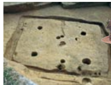
安来市・岩屋口遺跡 (古墳時代中ごろ)