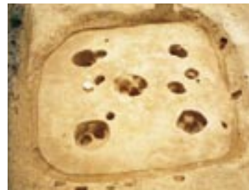
安来市・岩屋口遺跡 (弥生時代終り～古墳時代初め)