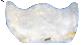
水晶製三輪玉 (東出雲町・島田池遺跡出土：7世紀)

主に首飾りとして使われたほかの玉と違い、刀の柄の飾りに使われた玉。丸い中央部の両側に突起がついた形をしている。