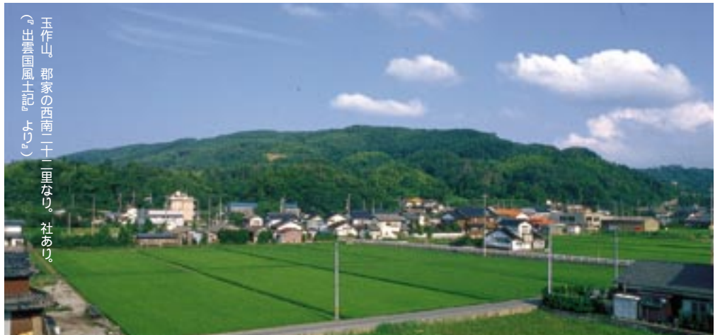
玉作山。郡家の西南二十里なり。社あり。(出雲国風土記)