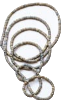
滑石製白玉 (松江市・二名留古墳出土：5世紀)