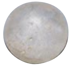
水晶製平玉 (玉湯町・出雲玉作跡出土：平安時代)