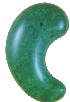
碧玉製勾玉 (松江市・釜代古墳出土：4世紀)