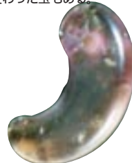
水晶製勾玉 (松江市・月廻古墳出土：5世紀)

湾曲した形をした玉で、一端には穴があけてある。時代や地域によって、碧玉やメノウ、水晶などいろいろな石を使っている。なかには大きな勾玉に小さな勾玉がついた、子持ち勾玉と呼ばれる変わった玉もある。