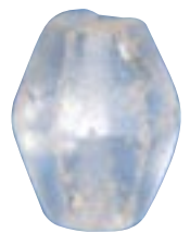
水晶製切子玉 (東出雲町・島田池遺跡出土：7世紀)

横から見ると六角形の形をしている。多面体の玉。水晶製のものが一般的で、古墳時代後期によく見られる。