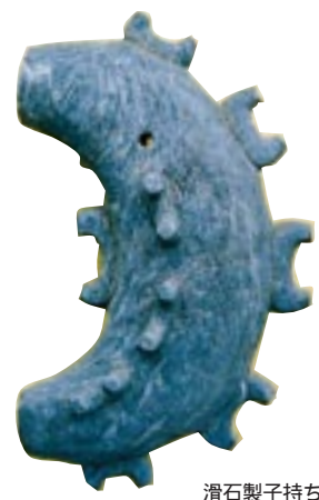
滑石製子持ち勾玉 (松江市・二名留古墳出土：5世紀)