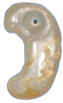
メノウ製勾玉 (東出雲町・島田池遺跡出土：7世紀)