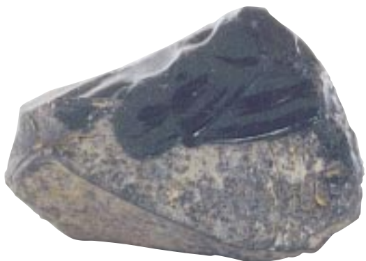
大原遺跡（安来市佐久保町）出土の黒曜石の原石 重さ4380g 写真は本州で見つかった原石で未加工のまま持ち帰っていたものである。

黒いガラスのようなイメージのある黒曜石だが、山から採掘されたときは、表面が風化して、ざらざらした灰色や灰黒色をしているものが多い。しかしこれを割ると、中から黒く輝く美しい表面が現れる。まさに割ることによって初めて生命が与えられる石といえる。