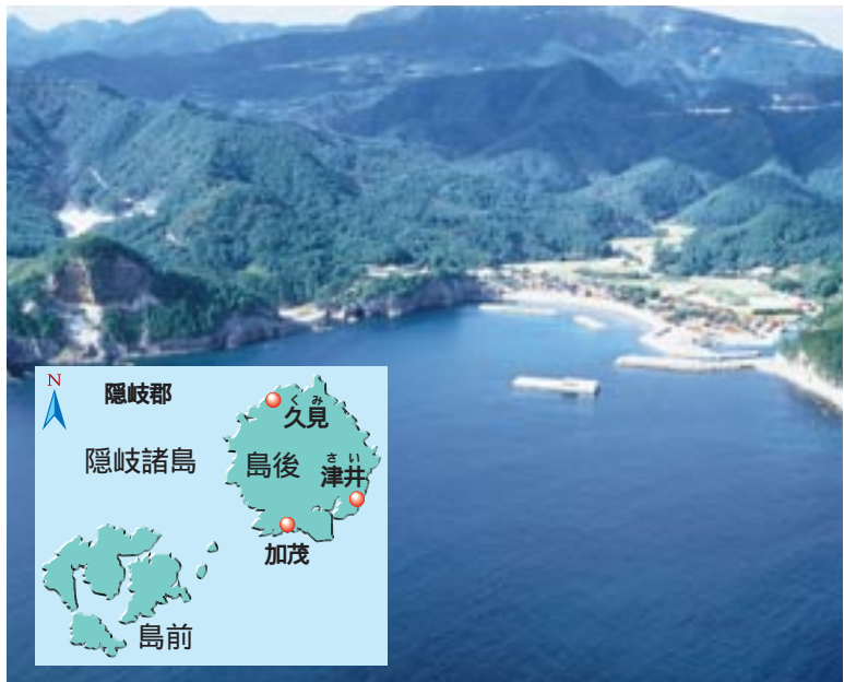
上空から見る隠岐の山々

隠岐が火山によってできた島であることは、意外に知られていないようです。しかし、島前にある国賀海岸や赤壁などを目にするといつい最近まで火山が活動していたかのような錯覚を感じます。火山活動によってできた岩石の一つが黒曜石ですが、いつ、誰が隠岐でこの石を発見したのかははっきりしていません。 日本海に浮かぶ隠岐は、本土から約五〇キロも離れています。「ここがらむねむね本土まで通んでいたわけですから、当時の人たちにとって、いかに黒曜石が大切だったかが想像できます。黒曜石の採れる場所として、五箇村の久見、西郷町の津井（男池）と加茂の三カ所が確認されていますが、実際に利用されたのは、久見産のものがほとんどです。