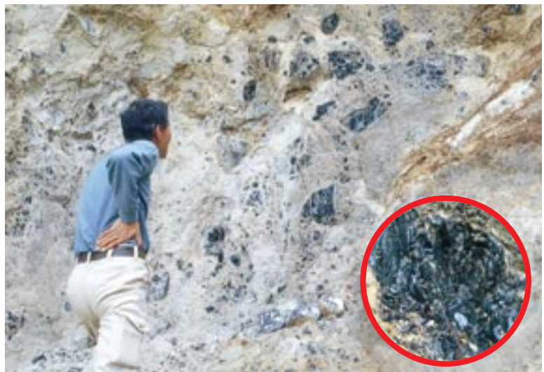
現代の黒曜石露頭（五箇村久見） 黒っぽく見えるのが原石。黒曜石は火山が噴火した際に、溶岩中のガラス成分が急激に冷えて結晶化したものである。

石器時代、だれもが欲しかった黒い石 黒曜石は、現在ではほとんど見ることが聞かなくなりましたが、大昔にはとても身近に使われていた石でした。