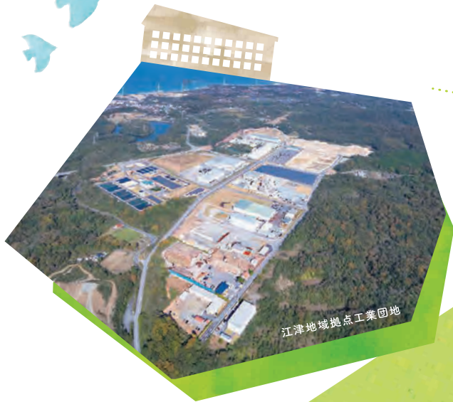
江津地域拠点工業団地