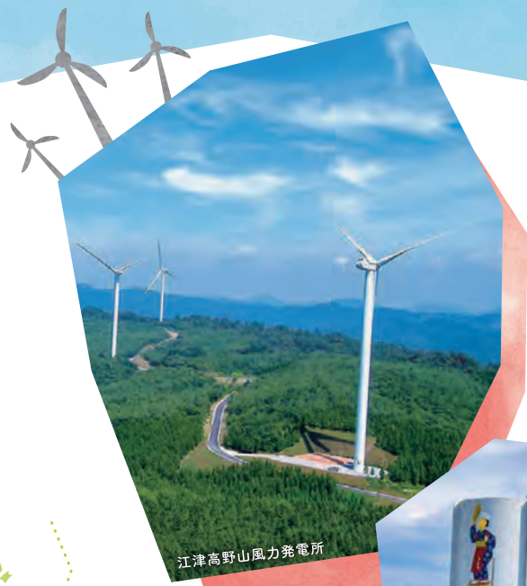
江津高野山風力発電所