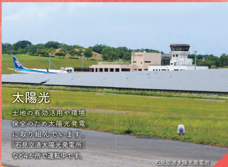
石見空港太陽光発電所

土地の有効活用や環境保全のため太陽光発電に取り組んでいます。「石見空港太陽光発電所」など4か所で運転中です。