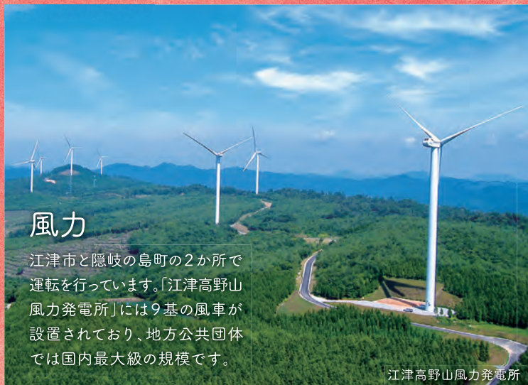
江津高野山風力発電所

江津市と隠岐の島町の2か所で運転を行っています。「江津高野山風力発電所」には9基の風車が設置されており、地方公共団体では国内最大級の規模です。