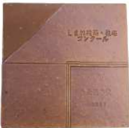
表彰銘板（石州敷瓦）