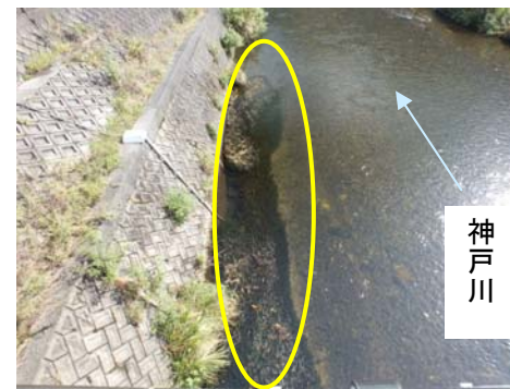
「藻」の状況 参考写真-3