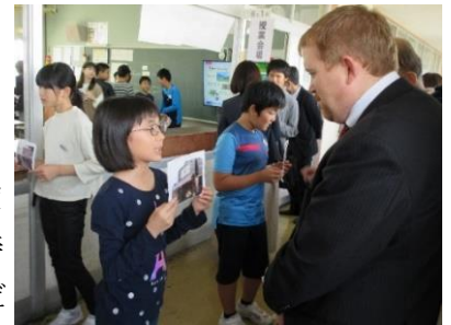
【住んでいる町を紹介しよう(今市小)】

この時の学習指導案を県教育委員会教育情報 Web EIOS に掲載していますので、是非ご覧ください、授業改善の一助にいただければ幸いです。