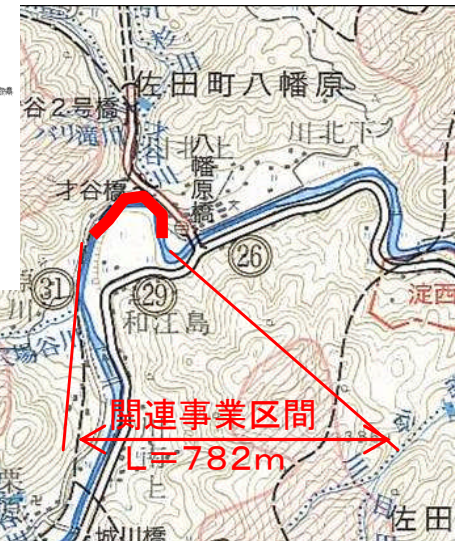
神戸川八幡原地区災害関連工事 実施箇所