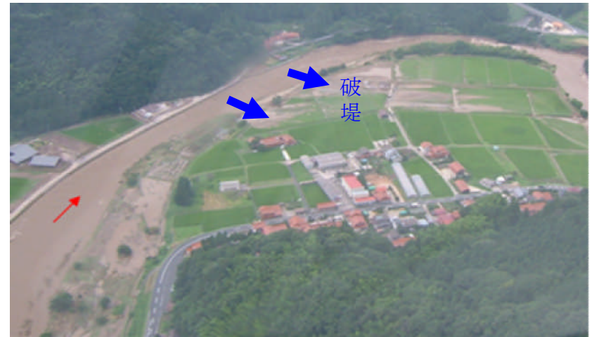
神戸川八幡原地区浸水状況(梅雨前線豪雨) 浸水被害面積14.9ha 床上浸水被害2戸