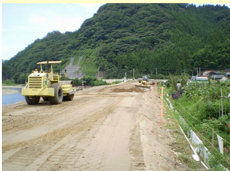
9月1日のB工区の築堤盛土の様子です