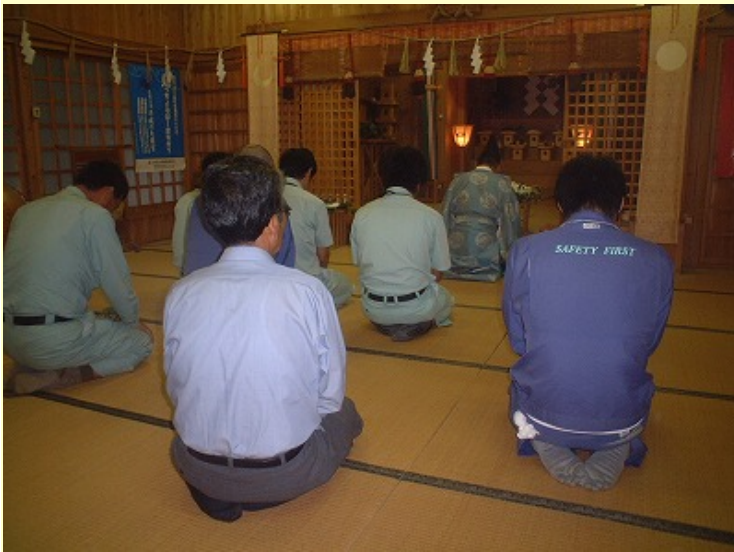
8月26日に富能加神社にて工事関係者により安全祈願を行いました

地元の皆様には何かとご迷惑をお掛けすることがあると思いますが、何卒ご理解、御協力のほどよろしくお願い致します。