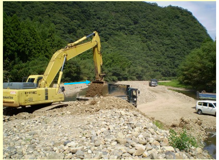
9月1日の河道掘削および土砂搬出の様子です