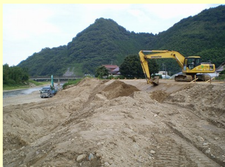
9月1日のC工区の築堤盛土の様子です