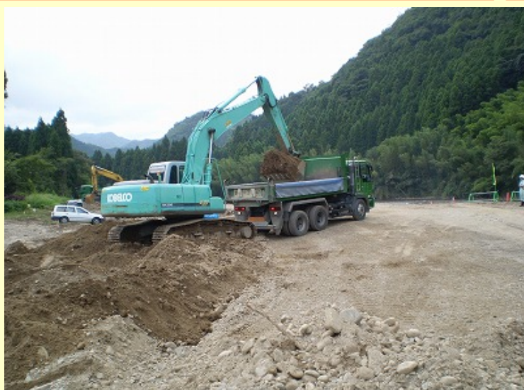
9月1日のC工区の河道掘削および土砂搬出の様子です この土砂はB工区の築堤盛土材と桜工区(その2)工事の築堤盛土材に使用しています