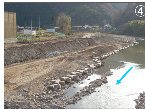
乙立橋上流部掘削状況