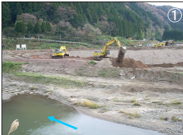
わかあゆの里掘削・築堤状況

後谷川樋門下部工事、乙立橋より上流部の掘削工事に着手しました。 乙立橋付近のパラペット工事、乙立橋より下流部の掘削工事、築堤工事も順調に進捗しており、現場内では連日重機がフル回転で作業をしています。 樋門のゲートは現在工場で製作中です。 工事の進捗率は約30%です。