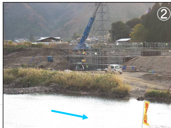
樋門下部工施工状況