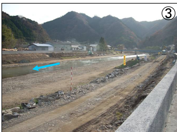
乙立橋下流部パラペット施工状況