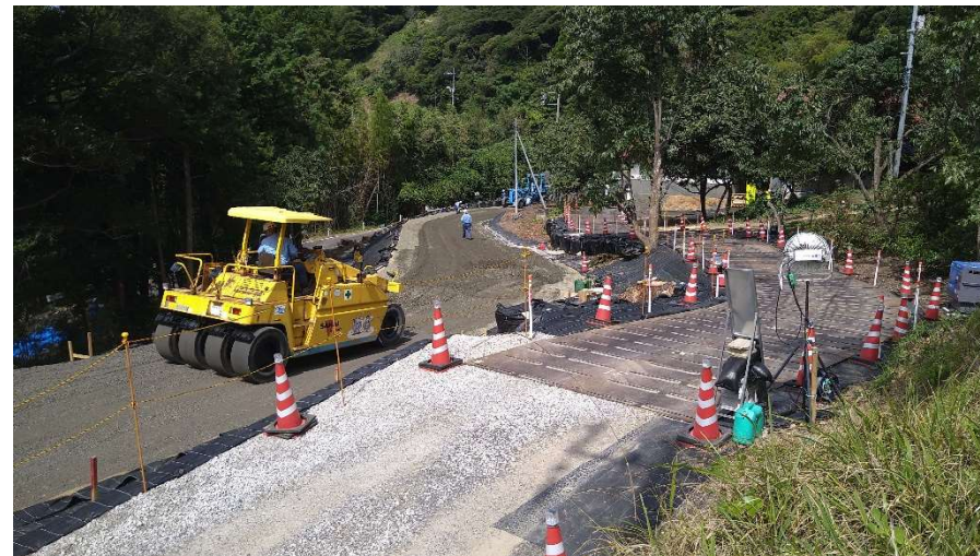
仮設迂回道路状況写真(令和6年9月3日 撮影)