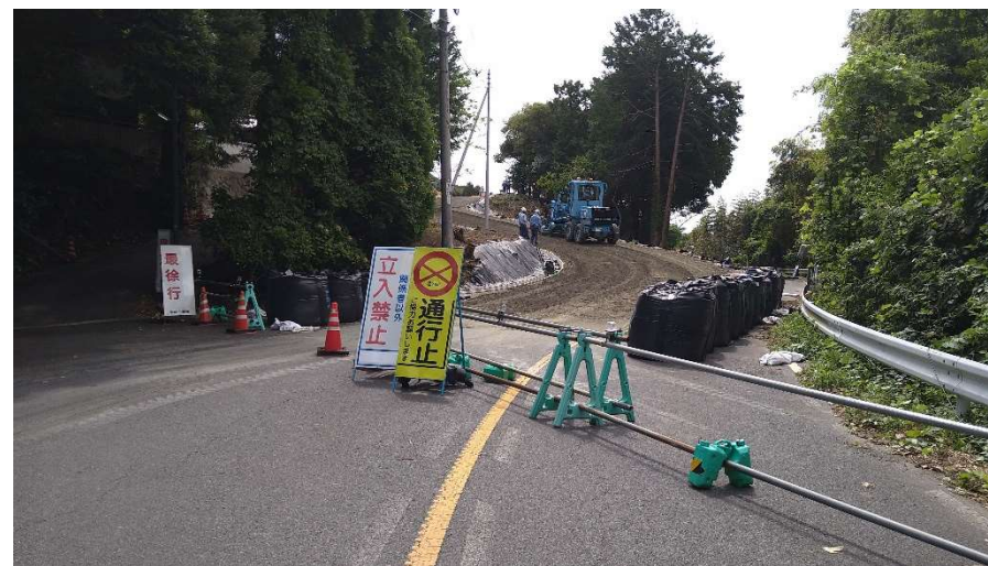
仮設迂回道路状況写真(令和6年9月3日 撮影)