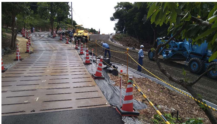
仮設迂回道路状況写真(令和6年9月3日 撮影)