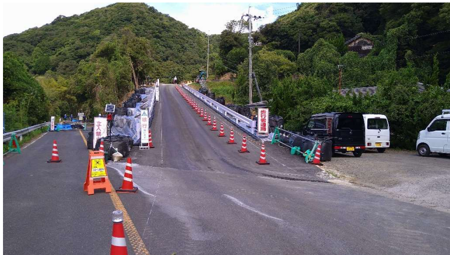
仮設迂回道路状況写真(令和6年9月3日 撮影)