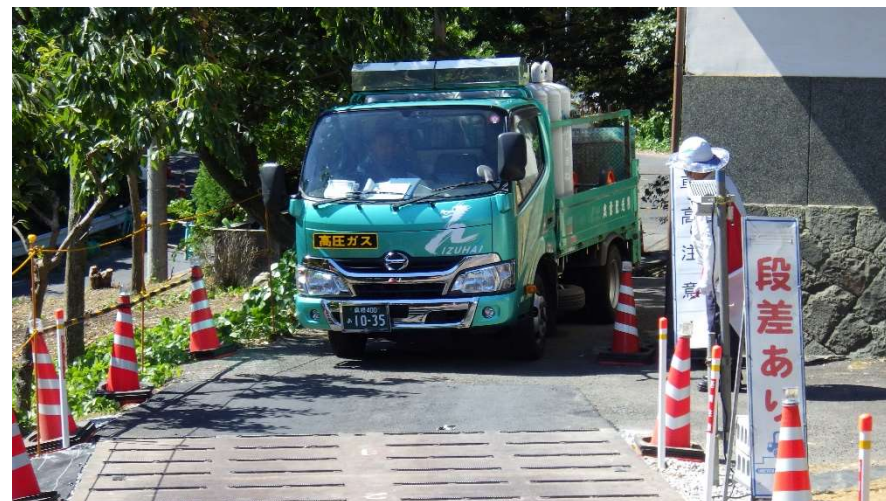
仮設迂回道路状況写真(令和6年8月13日 撮影)