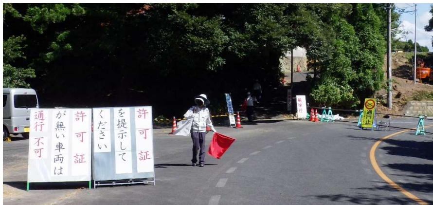
仮設迂回道路状況写真(令和6年8月13日 撮影)