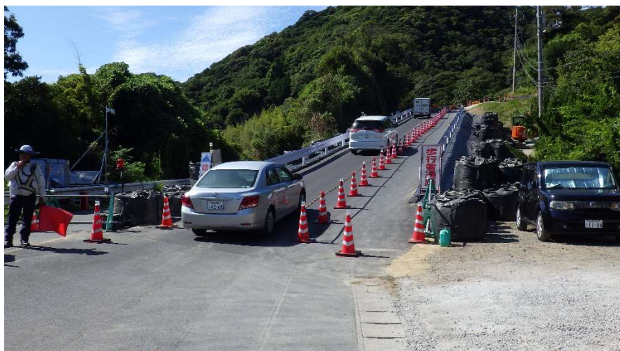
仮設迂回道路状況写真(令和6年8月13日 撮影)