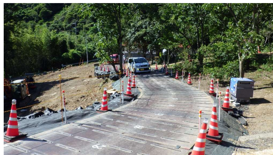
仮設迂回道路状況写真(令和6年8月13日 撮影)