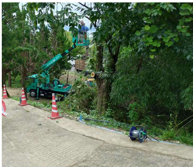
仮設迂回道路整備状況写真(令和6年7月24日 撮影)