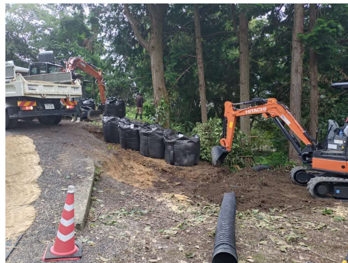
仮設迂回道路整備状況写真(令和6年7月24日 撮影)