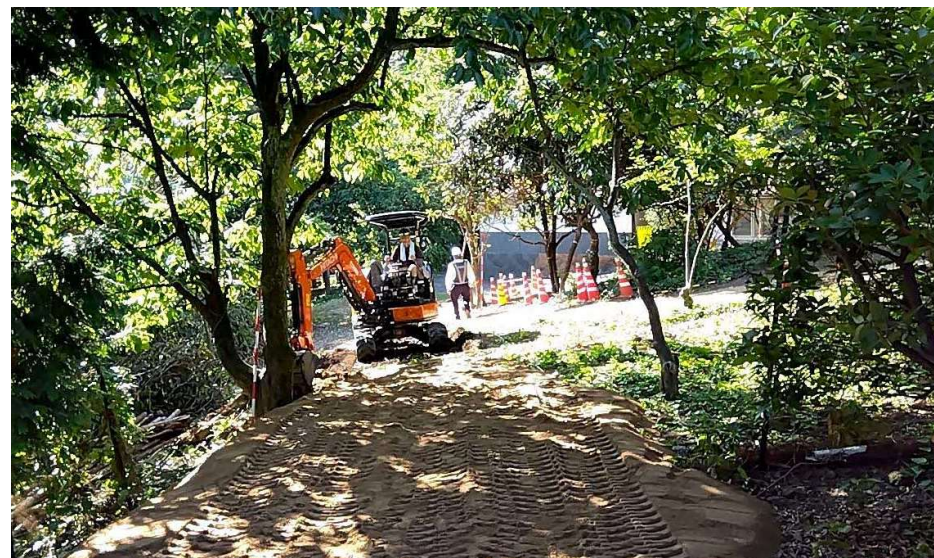
仮設迂回道路整備状況写真(令和6年7月24日 撮影)