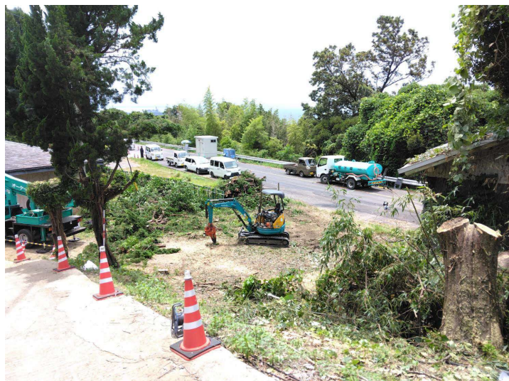
仮設迂回道路整備状況写真(令和6年7月24日 撮影)