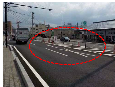
南進方向（中央病院側から市役所方向）：右折禁止