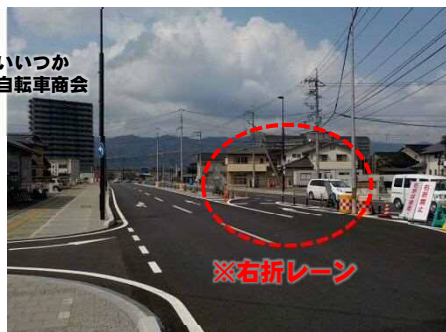
北進方向（市役所側から中央病院方向）：右折可