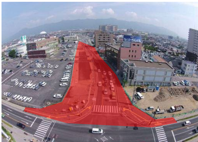
電線共同溝工事、歩道、車道の舗装工事を行います 西側の工事が概ね完了した後、車線を変更し、東側の工事に移ります