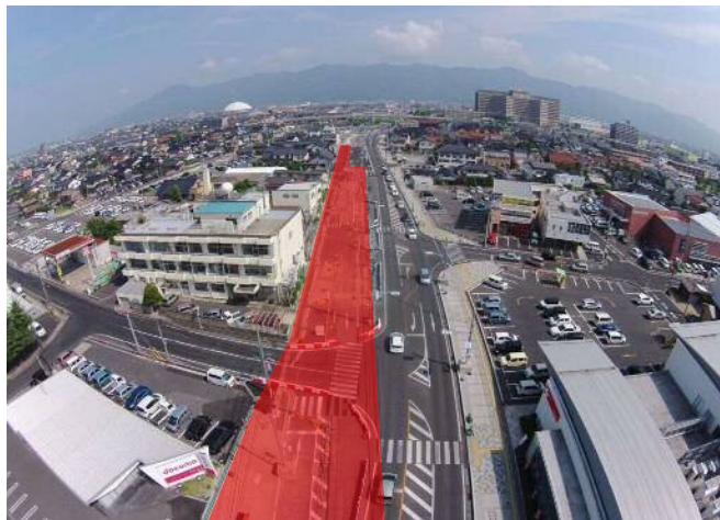
電線共同溝工事、歩道、車道の舗装工事を行います