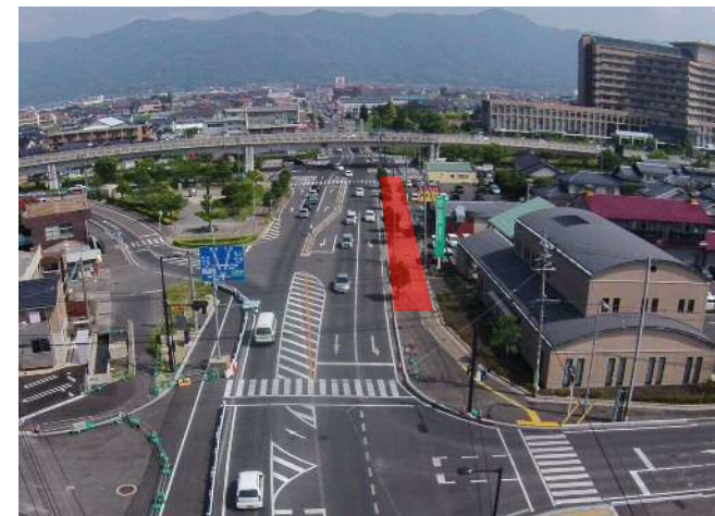
電線共同溝工事を行います

※工事に伴い、大規模な交通規制が生じる場合は、現地予告看板等によりお知らせいたします。