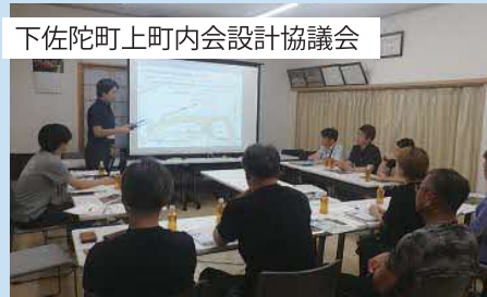
下佐陀町上町内会設計協議会