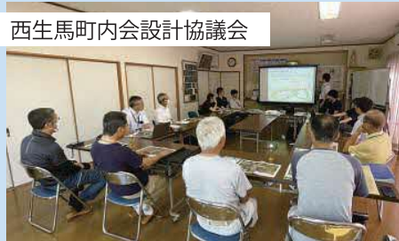
西生馬町内会設計協議会