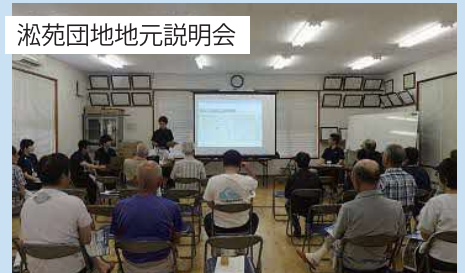
浜苑団地地元説明会