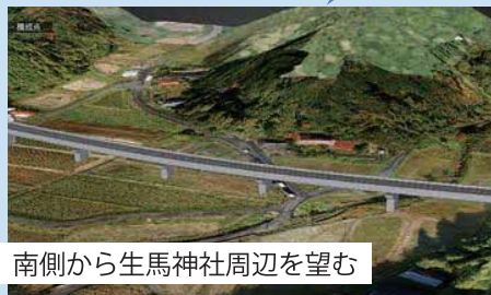
南側から生馬神社周辺を望む