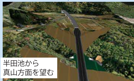
半田池から 真山方面を望む