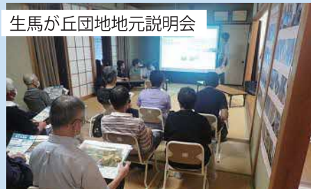
生馬が丘団地地元説明会