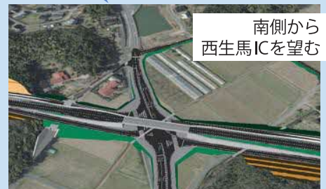
南側から 西生馬ICを望む