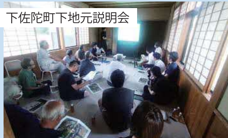
下佐陀町下地元説明会

令和6年8月～9月にかけて、設計協議会、地元説明会を開催し、各地区の設計案について貴重なご意見をいただきました。説明には、下図のような3次元図面を活用しました。