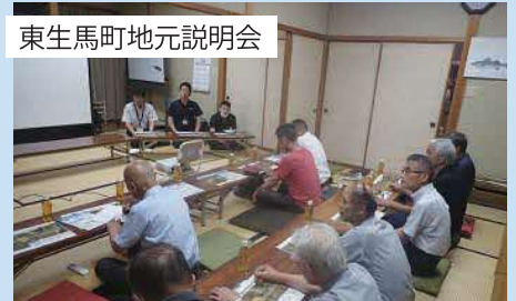
東生馬町地元説明会