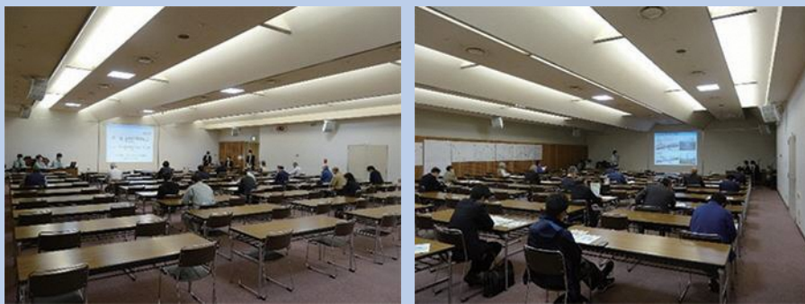
▲第1回都市計画説明会の様子

令和2年10月30日、31日に 第1回都市計画説明会(原案説 明)を開催し、39名の方に参加 いただきました。