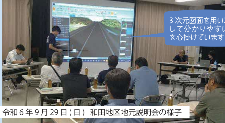
令和6年9月29日(日) 和田地区地元説明会の様子

令和6年9月29日(日)に、和田地区の住民の方々に向けて、持田工区の設計について説明会を開催しました。説明には、右図のような3次元図面を活用しました。