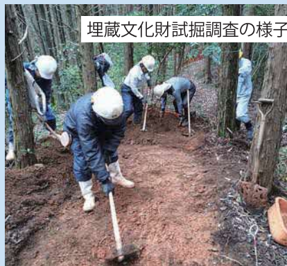
埋蔵文化財試掘調査の様子

現在、島根県埋蔵文化財調査センターと協力し、埋蔵文化財の試掘調査の実施を進めています。試掘調査の結果によっては、今後本調査を実施します。