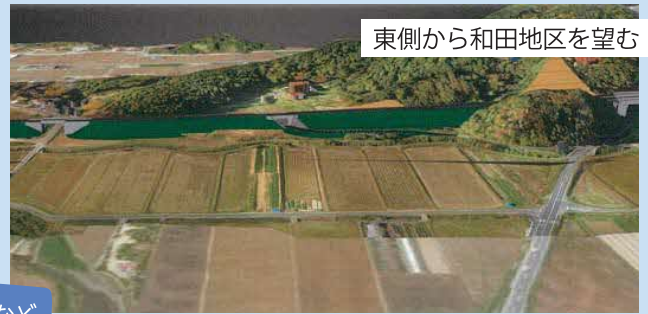
東側から和田地区を望む