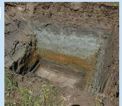
※写真は他地区での調査状況です。