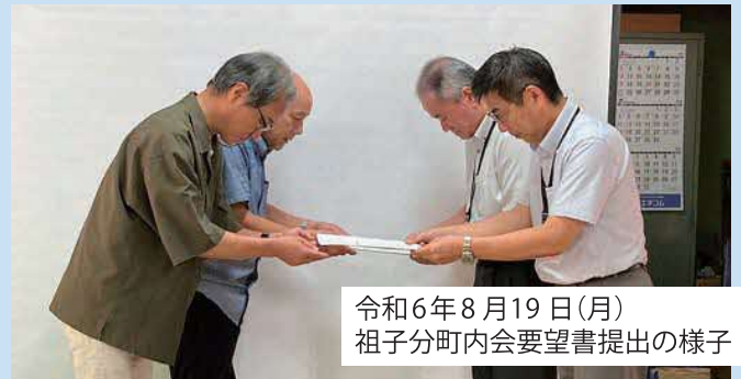
令和6年8月19日(月) 祖子分町内会要望書提出の様子