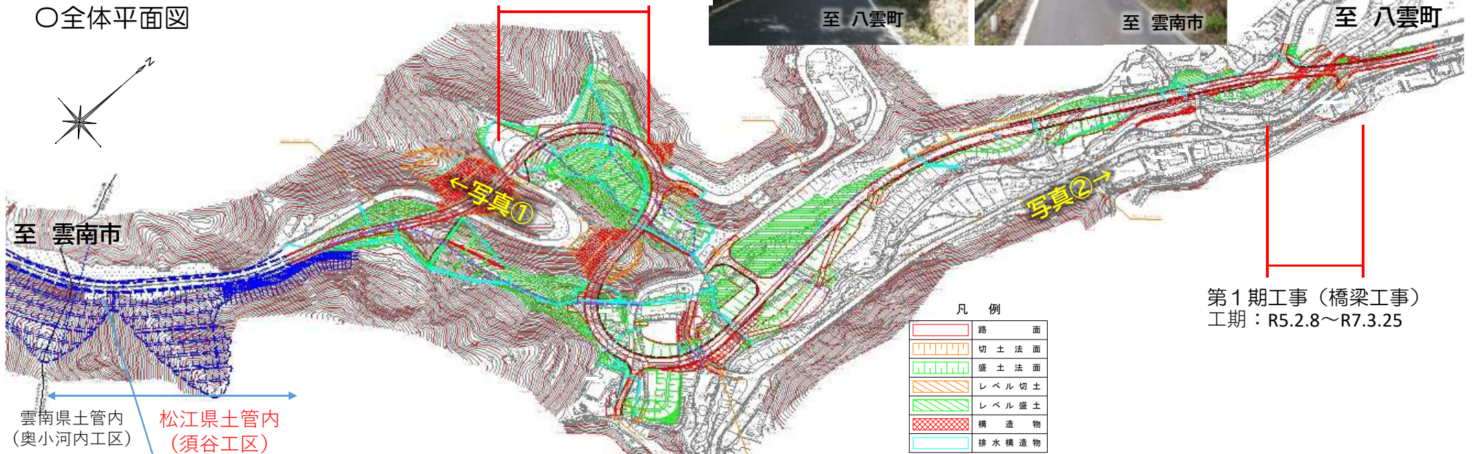
第1期工事 (橋梁工事) 工期：R5.2.8～R7.3.25