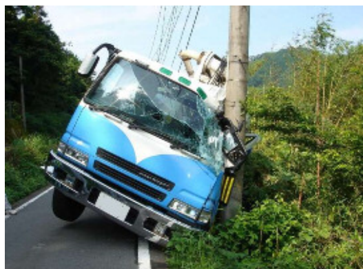
幅員狭小な現道での交通事故