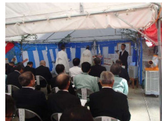
安全祈願祭の状況