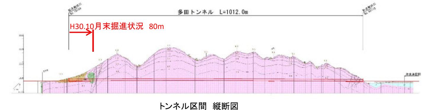
トンネル区間 縦断面図

トンネル工事は、平成30年9月5日に安全祈願祭をとり行い、掘削に取りかかりました。掘削当初は、地山が軟らかく重機による掘削を行いました。10月中旬より地山が硬くなってきたため、発破による掘削を進めています。