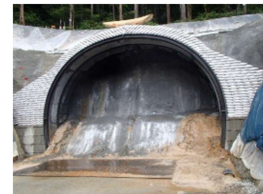
トンネル多田側坑口(掘削前)