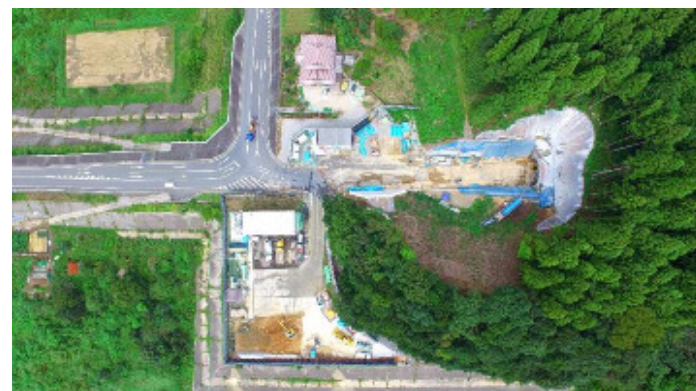
多田側坑口付近(ドローンで空撮)