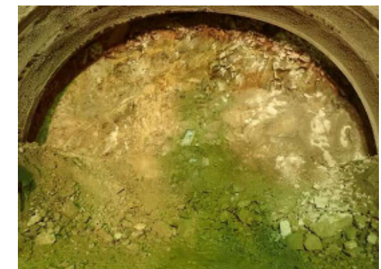
掘削面の状況(10月末時点)