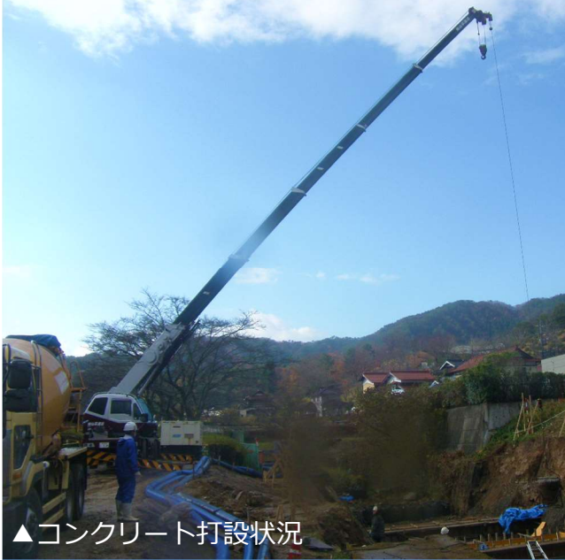
▲コンクリート打設状況