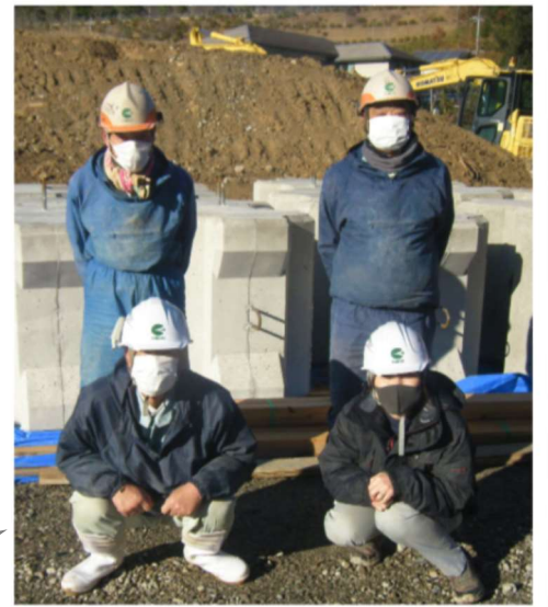
▲川村工務所の皆さま